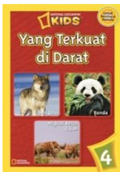
Gambar 1.1. Buku keluaran National Geographic

Hal ini sangat kontras bila kita membandingkan buku-buku anak impor yang membahas tema serupa. contohnya saja buku-buku keluaran National Geographic yang mampu mengutarakan fakta yang dilandasi dengan pendekatan bahasa yang tidak kaku. Dalam buku tersebut segala tersebut dianalogikan dengan kehidupan sehari-hari walau banyak dari pendekatan visualnya melalui fotografi.