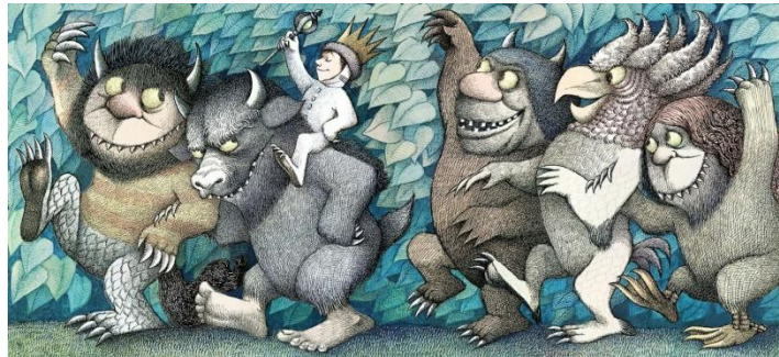
Gambar 1.2. Ilustrasi Where The Wild Things Are

hewan-hewan dengan cara yang sangat unik. Contohnya saja seperti Walter Disney yang menciptakan tokoh Mickey Mouse atau Ilustrator buku anak ternama Maurice Sendal dengan bukunya yang berjudul Where The Wild Things Are dengan berani menciptakan bentuk binatang yang sangat luar biasa.