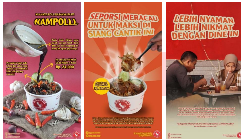
Gambar 12 Instagram story

Selain feeds, dibuat juga beberapa visual untuk Instagram story Geprek Mercau, Instagram story ini dipakai pada tahap search dimana saat menginformasikan event yang akan diselenggarakan, juga beberapa kali menginformasikan tentang produk Geprek Mercau agar eksistensi mengenai brand ayam gepreknya melekat di benak audiens.