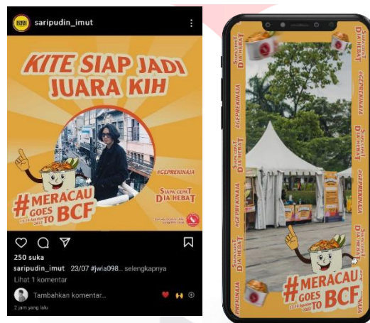
Gambar 16 Twibbon dan filter Instagram