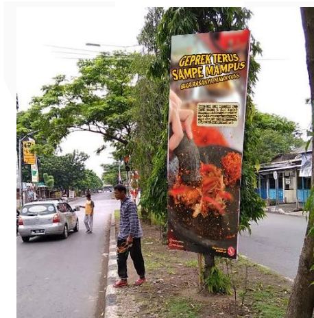
Gambar 5 T - Banner