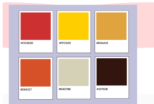
Gambar 3 Palet warna yang digunakan