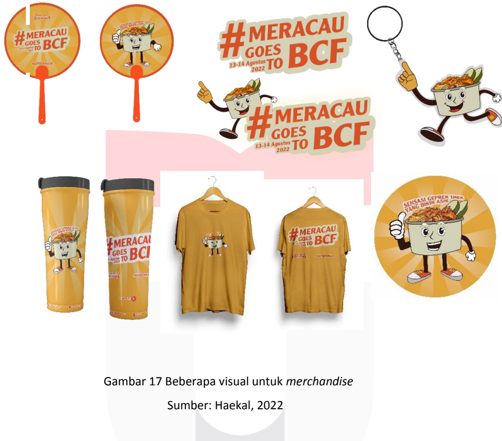
Gambar 17 Beberapa visual untuk merchandise

mendapat merchandise berupa sticker, keychain atau handfan, dan untuk yang berhasil mendapatkan promo dari bermain games dan mengupload keseruan mereka saat di booth maka akan mendapat merchandise eksklusif berupa botol tumblr dan t-shirt.