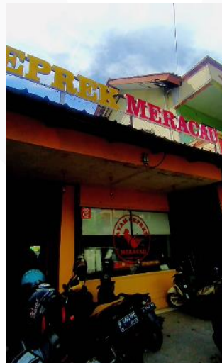
Gambar 8 Screenshot video review

Digunakan sebagai media pada tahap Interest disampaikan secara komunikatif agar menarik minat audiens supaya datang ke Geprek Mercau, dengan adanya konten berbentuk video review mengenai geprek mercau membuat audiens mengetahui lokasinya dan suasananya, hingga memunculkan rasa ketertarikan untuk mengunjungi kedainya.