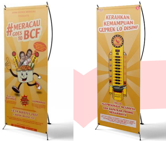
Gambar 14 X-Banner