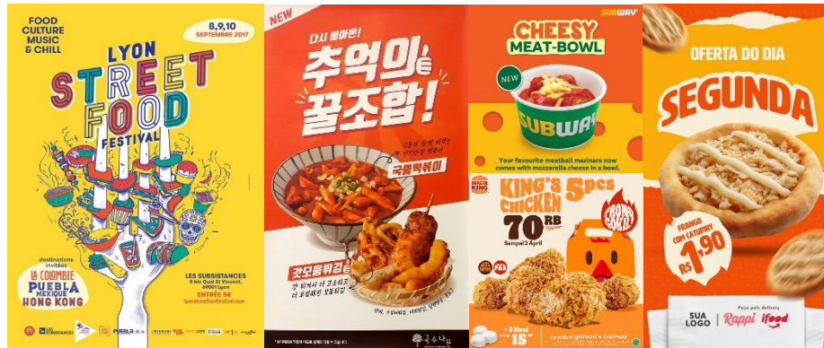
Gambar 1 Referensi Gaya Visual & Layout