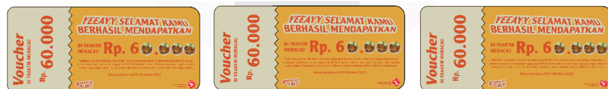
Gambar 18 Voucher