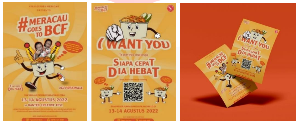
Gambar 9 Poster dan flyer #MercauGoesToBCF

Digunakan sebagai media yang berfungsi untuk menginformasikan event ditahap Interest dimana berisi sekilas informasi mengenai eventnya untuk penempatannya berada di tempat publik seperti alun-alun kota Serang, sekitar kampus, halte, dan untuk flyer berada di kedai geprek mercau sendiri yang mana flyer tersebut diberikan kepada konsumen sehabis membayar di kasir.