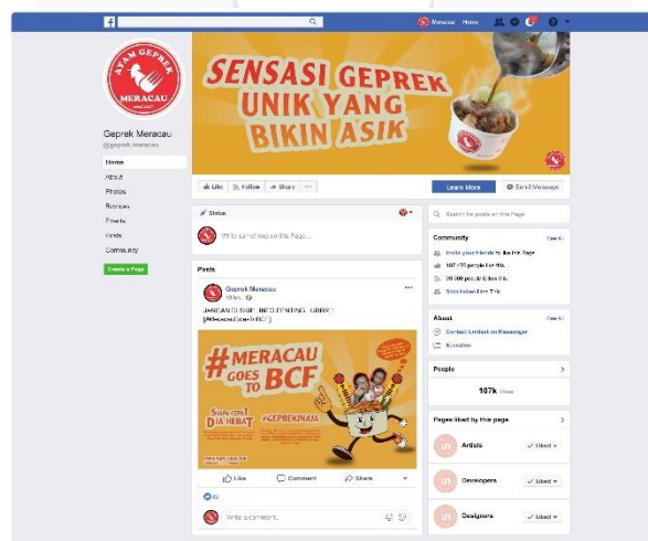
Gambar 13 Tampilan facebook geprek mercau