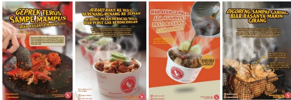
Gambar 4 Poster utama pada tahap Attention

audiens yang melihatnya hingga mereka tertuju dengan Geprek Mercau.