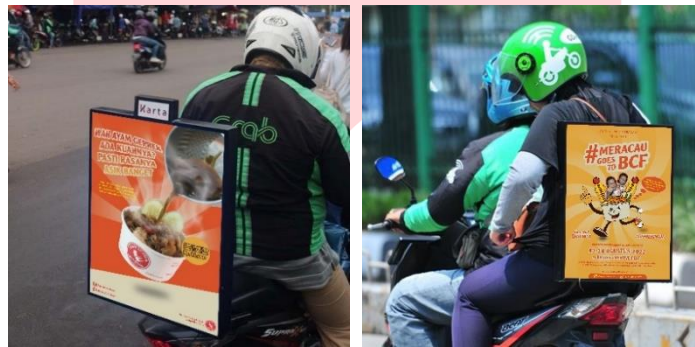
Gambar 6 Iklan papan motor/Goscreen

Penggunaan goscreen pada tahap Attention untuk membangun awareness lebih luas lagi karena bisa dilihat oleh siapa saja di jalanan, untuk penggunaan iklan papan motor ini juga diterapkan pada tahap interest untuk menginformasikan event yang diselenggarakan agar bisa dilihat oleh audiens.