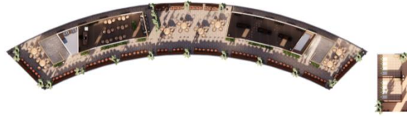
Gambar 2. Denah general lantai 2