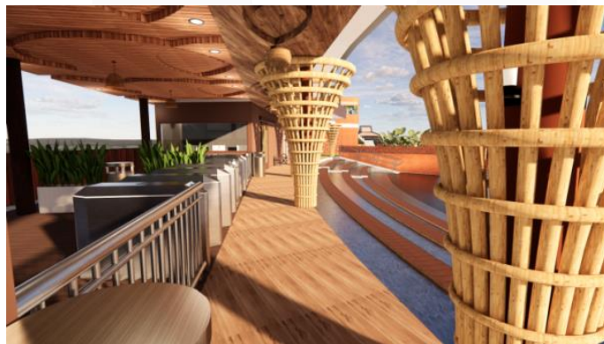
Gambar 5. Pengolahan elemen langit-langit pada area koridor

Motif Merak Ngibing ini diaplikasikan pada furniture yang terletak pada area kasir. Motif yang diambil berasal dari pola ekor merak yang berbentuk seperti mata, motif ini diaplikasikan dengan artwork yang berwarna dasar krem dan motif mata merak berwarna biru, tosca, kuning, serta oranye.