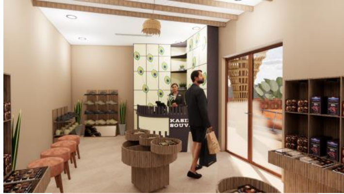
Gambar 4. Pengolahan desain pada furnitur ruang souvenirshop yang terinspirasi dari motif Merak ngibing

ekor merak terdapat pola mata. Ceiling ini menggunakan material PVC yang bermotif kayu.