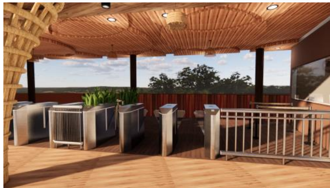
Gambar 3. Pengolahan desain pada langit-langit ruang lobby yang terinspirasi dari motif Merak Ngibing

Berikut ini merupakan ruangan dengan diterapkan motif Merak Ngibing sebagai ciri khas Budaya Garut: