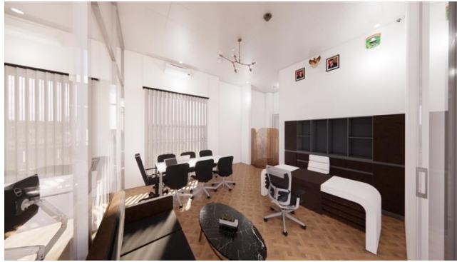
Gambar 3 Visualisasi Ruang Kabag

Gambar diatas merupakan visualisasi dari pengaplikasian material lantai parquet pada area kerja pegawai pada lantai 1. Pada area ini menggunakan parquet berwarna coklat. Pemilihan motif material ini terinspirasi dari bentuk anyaman dan material kayu yang digunakan adalah material local berasal dari daerah setempat.