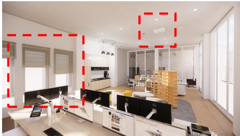
Gambar 5 Implementasi Penghawaan

Konsep penghawaan pada perancangan ulang kantor ini menggunakan pencahayaan alami yang berupa bukaan jendela dan pintu. Untuk pencahayaan buatan menggunakan AC Casette dengan sistem split bertujuan untuk mengisi seluruh ruang dan menghemat energi.