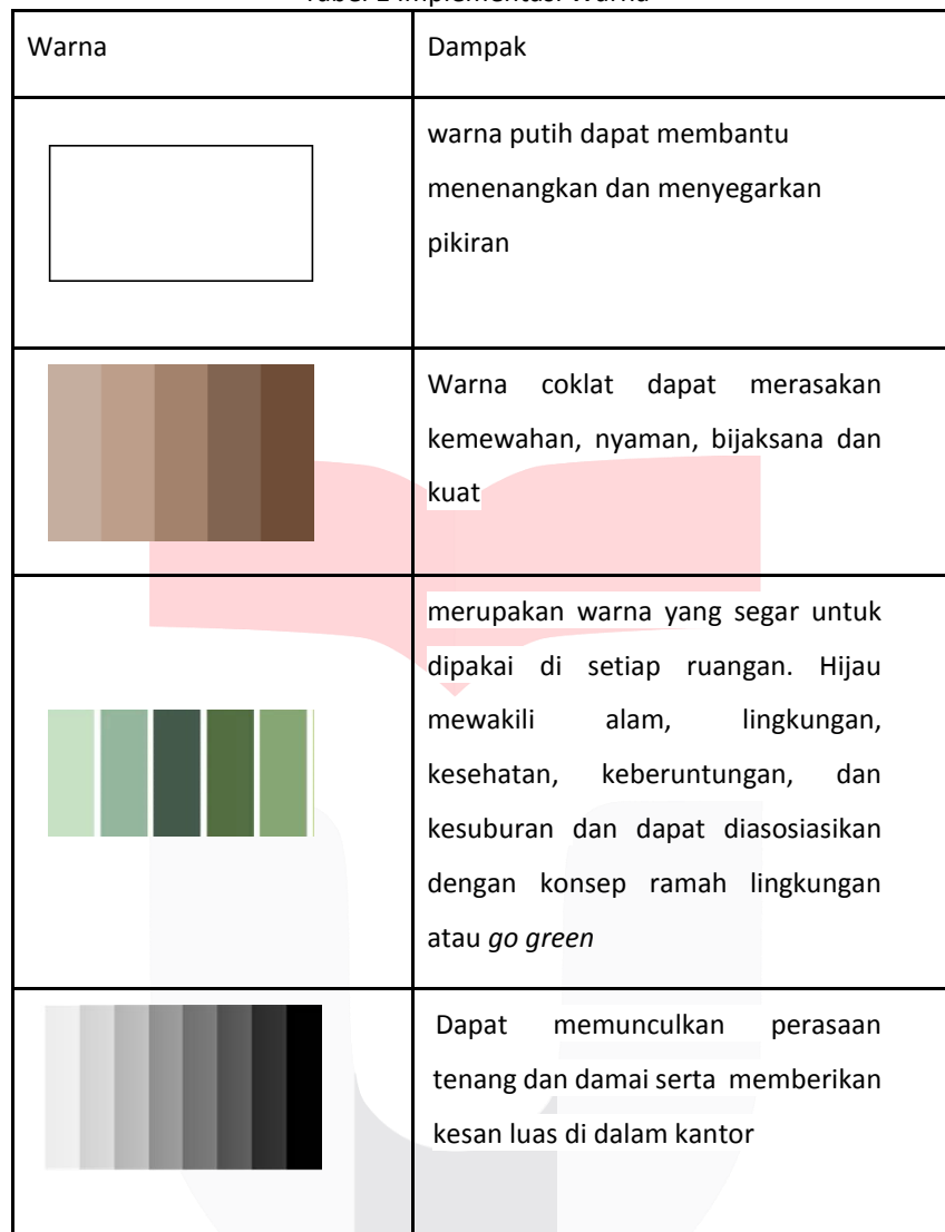
Tabel 1 Implementasi Warna