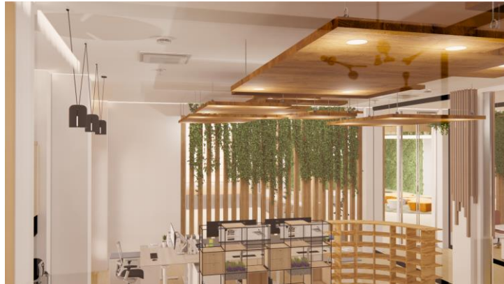
Gambar 2 Visualisasi Ruang Kerja