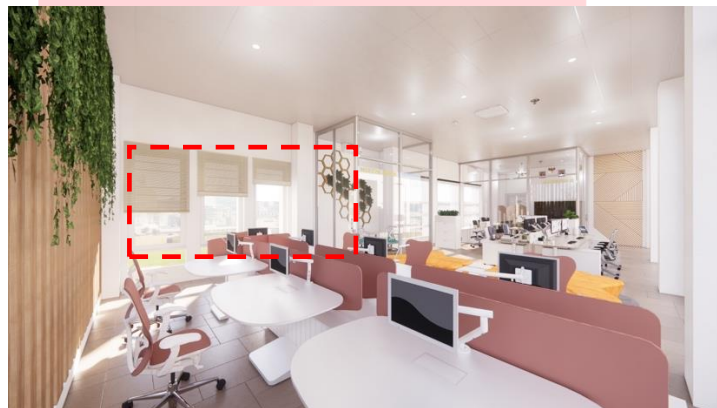
Gambar 4 Visualisasi Ruang Kerja

Konsep pencahayaan yang digunakan pada perancangan kantor ini adalah pencahayaan alami dan pencahayaan buatan. Pencahayaan alami berasal dari bukaan seperti jendela dan pintu masuk sedangkan pencahayaan buatan yang digunakan berupa lampu LED, downlight, lampu gantung dan lampu panel.