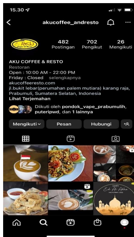
Gambar 1. 2 Instagram Aku Coffe and Resto