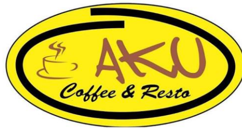
Gambar 1. 1 Logo Aku Coffee and Resto