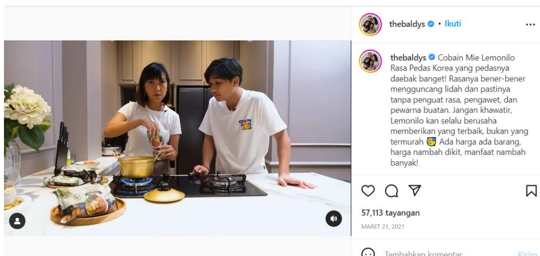
Gambar 1. 7 Mie Lemonilo Rasa Pedas Korea