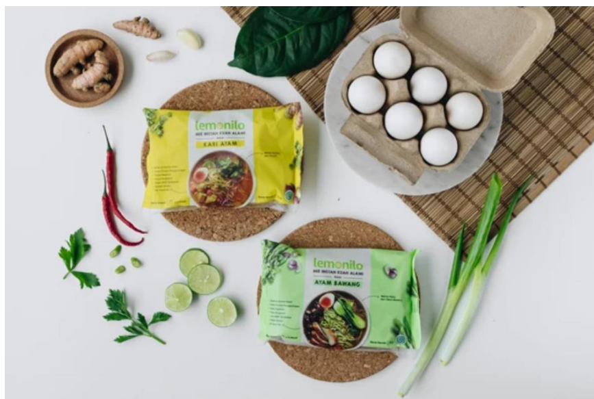
Gambar 1. 4 Varian Mie Lemonilo