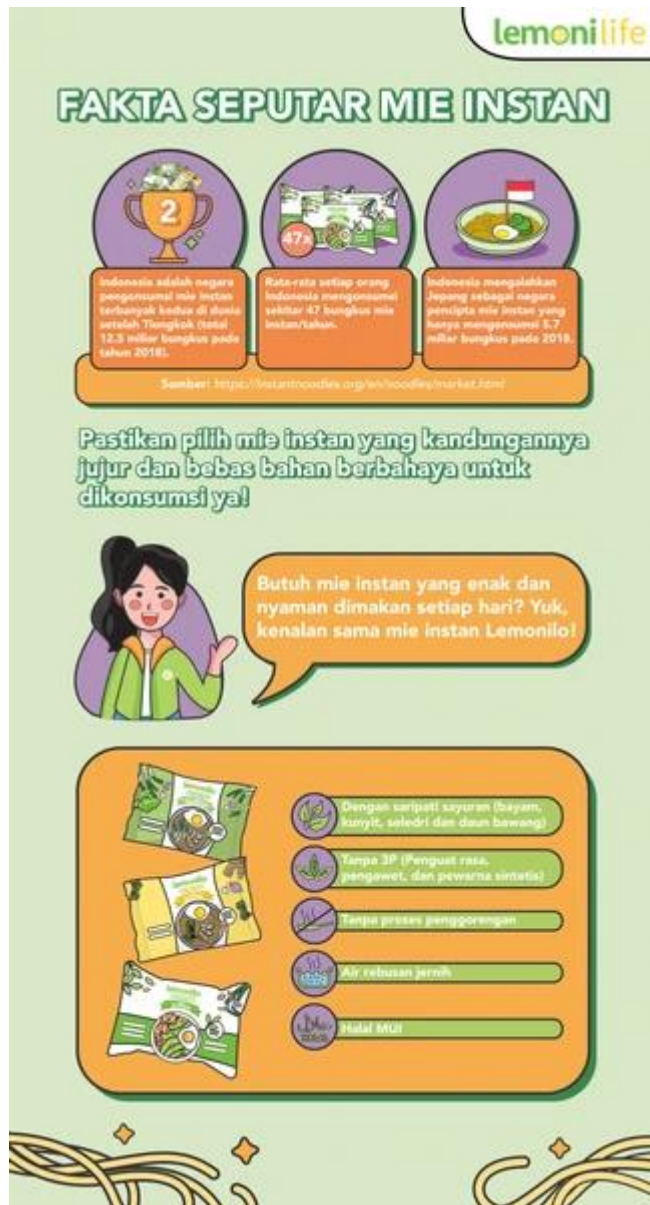
Gambar 1. 3 Fakta Seputar Mie Instan