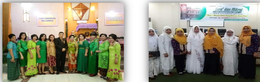
Gambar 1.3 Perayaan Hari Natal dan Peringatan Isra' dan Mikraj Nabi Muhammad SAW 1440 H RSUD Dr. R.M. Djoelham kota Binjai

Dalam aktivitas kerja sehari-hari, RSUD Dr. R.M. Djoelham kota Binjai telah berupaya menciptakan hubungan yang baik dengan para pegawainya seperti mengadakan kegiatan di luar jam kerja, mengadakan kegiatan ibadah bersama-sama serta mengadakan perayaan hari raya keagamaan. Setiap tahunnya RSUD Dr. R.M. Djoelham kota Binjai mengadakan ibadah kebaktian dan perayaan Hari Natal khusus untuk yang beragama kristen serta perayaan Peringatan Isra' dan Mikraj Nabi Muhammad SAW 1440 H RSUD Dr. R.M. Djoelham kota Binjai khusus yang beragama islam. Adapun dokumentasi perayaan hari besar keagamaan di RSUD Dr. R.M. Djoelham kota Binjai seperti gambar 1.3 sebagai berikut: