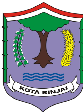
Gambar 1.1 Logo Perusahaan RSUD Dr. R.M. Djoelham kota Binjai

RSUD Dr. R.M. Djoelham kota Binjai merupakan bagian dari keluarga besar pemerintah kota Binjai. Berikut merupakan logo RSUD Dr. R.M. Djoelham kota Binjai sebagaimana pada gambar 1.1.