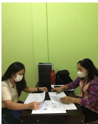
Gambar 1.5 Wawancara dengan pegawai RSUD Dr. R.M.

Berdasarkan hasil wawancara tersebut tampak bahwa masih perlunya kegiatan yang signifikan untuk meningkatkan keterlibatan penuh pegawai dalam melakukan pekerjaannya sehingga pegawai merasa engaged dan memiliki suatu kesadaran terhadap tujuan perannya untuk memberikan layanannya sehingga membuat pegawai akan memberikan seluruh kemampuan terbaiknya. Sridhar dan Thiruvenkadam (2014) berpendapat bahwa perilaku pegawai yang engaged akan melakukan upaya ekstra untuk meningkatkan kinerja organisasi, tidak hanya dengan meningkatkan kinerjanya sendiri, melainkan dengan memfokuskan juga pada pengembangan keseluruhan organisasi. Adapun bukti wawancara dengan pegawai RSUD Dr. R.M. Djoelham kota Binjai terdapat pada gambar 1.5 sebagai berikut: