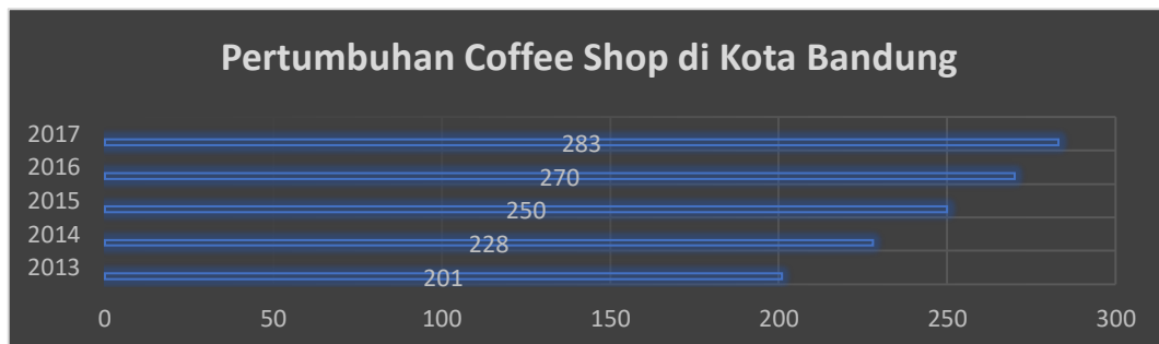
Gambar 1.3 Pertumbuhan Coffee Shop di Kota Bandung 2013 – 2017

dikenal sebagai penghasil kopi terbaik dunia (Safitri et al., 2019). Hal ini membuat usaha Coffee shop banyak berkembang di Indonesia seiring dengan fenomena anak remaja yang makin menggemari kopi. Coffee shop juga digunakan sebagai ajang eksistensi virtual yang diminati untuk ditampilkan di berbagai media sosial (Harlim & Siagian, 2020). Coffee shop sekarang ini tujuan utamanya tidak hanya untuk membeli kopi atau tempat minum kopi saja tetapi fungsinya sekarang hampir sama dengan kafe pada umumnya (Rasmikayati & Saefudin, 2020). Hal ini membuat perkembangannya setiap hari semakin berkembang dan bertambah banyak. Perkembangan Coffee shop seiring berkembangnya waktu juga terus terjadi perkembangan dan penambahan, sesuai dengan data dari Badan Pusat Statistik Kota Bandung tahun 2017 sudah ada 283 tempat, angka tersebut selalu bertambah dari tahun 2013, berikut diagram jumlah pertumbuhan Coffee shop di Kota Bandung.