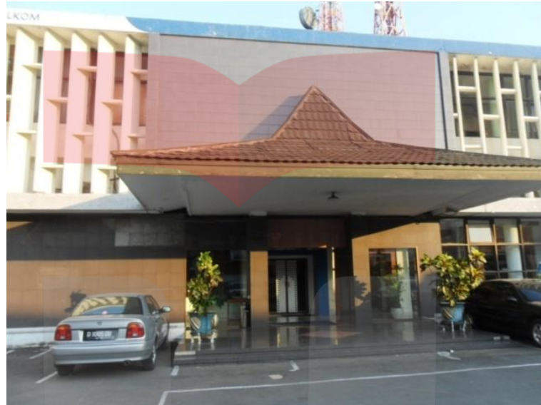
Gambar 1.2 Lokasi Perusahaan CV Bunda

Perusahaan yang dipilih untuk dilakukan pengamatan adalah CV Bunda Cirebon yang berlokasi di Jalan Pagongan No. 11 Cirebon. Telp: (0231) 3311285 atau (0231) 226785