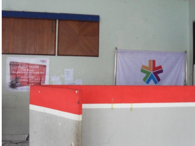
Foto tampak depan Kantor Cabang Utama CV Bunda, Gedung Telkom Jl. Pagongan No. 11