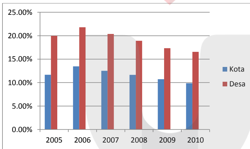
Persentase Penduduk Miskin Indonesia Dari tahun 2005-2011