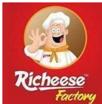
Gambar 1. 1 Logo Perusahaan

Adapun logo perusahaan ditampilkan pada gambar di bawah ini: