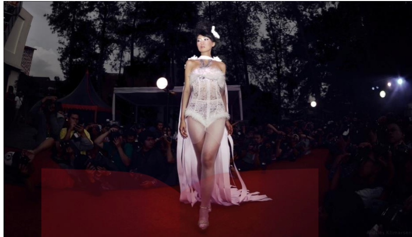
Gambar II. 4 Contoh Komposisi tengah

Sedangkan komposisi modern ketiga adalah “di pinggir”, alias benda utama dalam foto dipasang di paling tepi kiri atau kanan foto. Saat ini komposisi foto relatif sangat bebas. Tetapi sesungguhnya hanya pengembangan saja dari komposisi jenis “di tengah” atau “di tepi” atau “merata”. Bagaimana pun komposisi adalah pilihan personal yang menyangkut selera. Tidak ada istilah salah dan tak ada benar di sini.