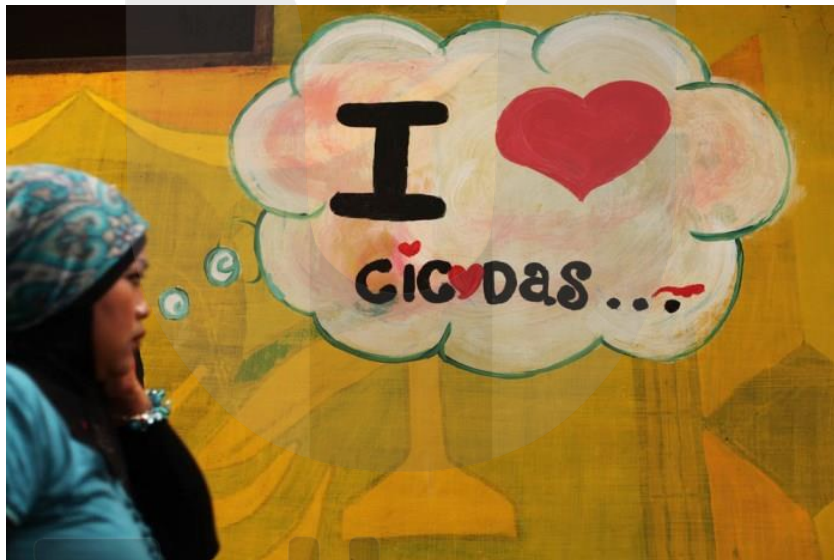
Gambar II. 8 Kidung kasih kampung Cigadas

Street Photography adalah genre non-formal fotografi yang menampilkan objek dalam situasi candid ditempat umum seperti jalan, bangunan, taman, pantai, mall dan ruang publik lainnya. Hal tersebut biasanya menggunakan teknik fotografi langsung untuk menunjukkan visual foto secara nyata dari situasi yang ada, foto bisa terkesan ironis atau emosional seakan menggambarkan cerminan masyarakat. Framing dan waktu merupakan aspek kunci dari pembuatan foto dengan tujuan untuk membuat gambar yang mempunyai tujuan untuk menunjukan informasi dari foto tersebut atau fotografer dapat mencari gambaran yang mempunyai nilai kejadian yang patut diangkat dari tempat kejadian perkara, sebagai bentuk dokumenter sosial. (Scott Clive, 2007)