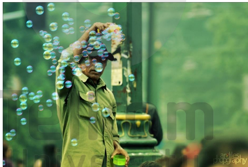
Gambar II. 5 Contoh Komposisi Pinggir

Sedangkan komposisi modern ketiga adalah “di pinggir”, alias benda utama dalam foto dipasang di paling tepi kiri atau kanan foto. Saat ini komposisi foto relatif sangat bebas. Tetapi sesungguhnya hanya pengembangan saja dari komposisi jenis “di tengah” atau “di tepi” atau “merata”. Bagaimana pun komposisi adalah pilihan personal yang menyangkut selera. Tidak ada istilah salah dan tak ada benar di sini.