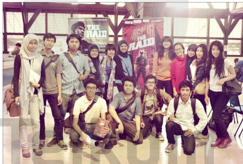
Gambar II. 3 Contoh Komposisi Merata

Sejalan dengan berlalunya waktu, muncul bermacam teori komposisi kontemporer yang tiap jenisnya pun justru sangat tak terumuskan dengan tegas. Jenis komposisi modern yang pertama adalah “merata”. Elemen-elemen foto diatur serata mungkin. Misal foto produk, foto keluarga. Komposisi “merata” dipakai untuk memotret benda yang banyak. Varian dari “merata” adalah kita menonjolkan beberapa di antara obyek yang terpotret itu.