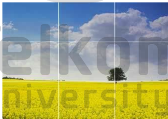
Gambar II. 2 Contoh Komposisi Rule of Thirds