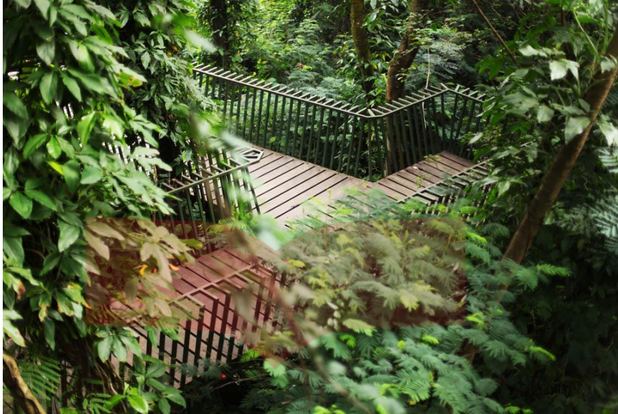
Gambar II. 7 Sebuah Titian didalam Hutan Kota dan Ceritanya

Esai foto dibuat dengan tujuan untuk menggambarkan fenomena yang terjadi, bukan sebagai pemecah masalah. Berkaitan dengan ini, Erik Pasetya (Surya, 1996 : 91) berpendapat bahwa “Esai memang tidak memecahkan persoalan, tapi melukiskannya. Esai melukiskan kehidupan sebagai fenomena kehidupan manusia, dalam aspek intelektual maupun emosionalnya.”