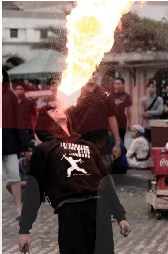
Gambar II. 6 Contoh Foto Timing