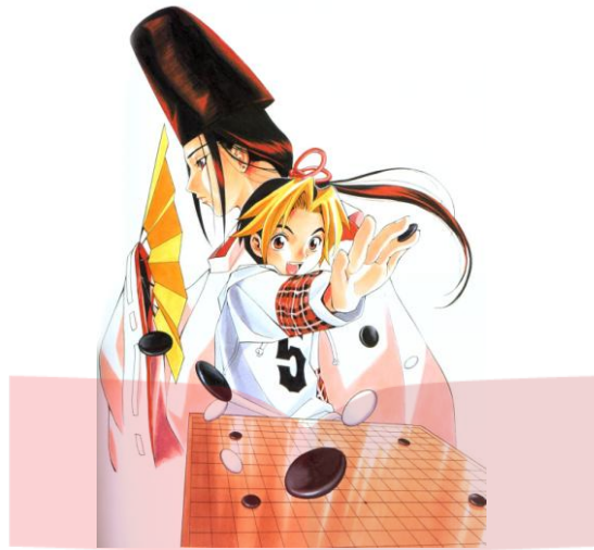
Gambar 1.1 Ilustrasi Hikaru no Go

Sumber : Takeshi Obata, Hikaru no Go Artbook