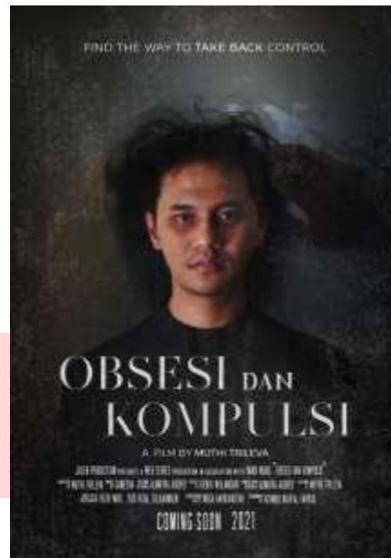
Gambar 2. Poster Web Series “Obsesi dan Kompulsi”