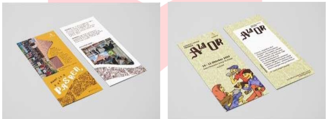
Gambar 4. Rancangan flyer

Flyer tentang Pasren dibuat berisikan informasi ringkas untuk dibagikan kepada masyarakat. Selain tentang Pasren, terdapat juga Flyer yang dibuat sebagai bentuk ringkas dari poster pameran “Awor”. Flyer ini berukuran 9,9 x 21 cm dicetak artpaper depan belakang dan didesain dengan berdasarkan poster sebelumnya. Flyer ini nantinya akan dibagikan langsung kepada masyarakat dan tamu undangan pameran.