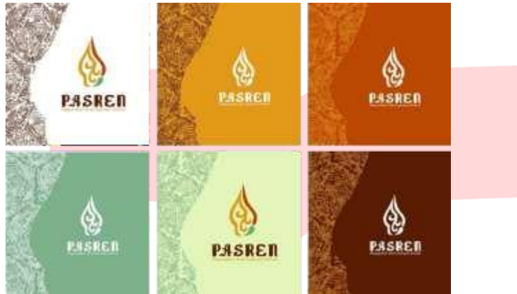
Gambar 1. Logo dan Supergrafis