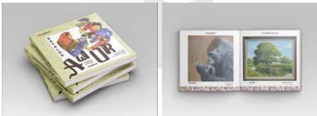
Gambar 3. Rancangan katalog