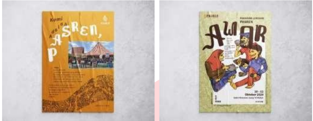
Gambar 2. Rancangan poster Sumber : Dokumentasi Pribadi

Spanduk ini dibuat sebagai informasi terhadap masyarakat tentang hadirnya Pasren. Selain itu, terdapat juga spanduk yang dibuat sebagai tanda kepada masyarakat tentang diadakannya pameran “Awor”. Spanduk ini berukuran 300 x 100 cm menggunakan bahan vinyl dan didesain dengan berdasarkan poster sebelumnya. Spanduk ini akan dipasang didepan gedung dilaksanakannya pameran, guna menarik perhatian masyarakat.