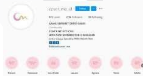
Gambar 1 Instagram Akun Cover Me

Cover Me cukup aktif dalam pembuatan konten kreatif di Instagram, dimana Cover Me menggunakan fitur Instagram reels sebagai pembuatan video pendek yang memperlihatkan visual produk, dan fitur Instagram TV untuk memberikan review, baik dari Live maupun upload video dengan durasi lebih dari 1 menit. Selain itu, dalam fitur Instagram Stories, Cover Me turut mengikuti penggunaan trend dan fitur-fitur yang sedang banyak digunakan oleh pengguna Instagram seperti polling, QnA, insert link yang mengarahkan pada situs e-commerce, sehingga dapat menaikkan engagement Instagram Cover Me.