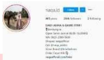
Gambar 5 Instagram Naqa.id

panas saat digunakan. Naqa.id aktif di sosial media Instagram dengan jumlah pengikut 264.000, dan platform penjualan melalui official website, shopee, tokopedia.