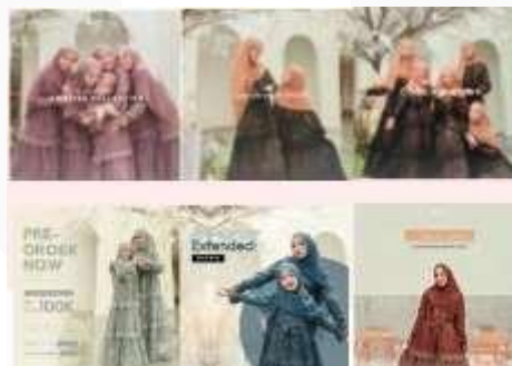
Gambar 7 Foto Produk Feeds Instagram

Poster digital media sosial diatas akan diposting pada media Instagram di akun Instagram Cover Me Id dan beberapa postingan akan diposting dengan sistem Carousel Post. Poster tersebut terdapat beberapa informasi seperti awareness, informatif dan persuasif.