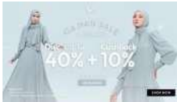
Gambar 8 Banner Shopee

Banner Shopee diatas termasuk salah satu strategi marketing yang dipakai. Dengan mengusung tema “Gajian Sale”, Cover Me akan menarik minat target audience untuk membeli produk Cover Me dengan potongan harga yang diberikan.