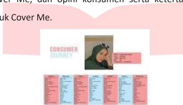
Gambar 4 Consumer Journey

Analisa ini dilakukan dengan mengetahui A.O.I dari konsumen Cover Me yang dilakukan dengan metode pencarian data wawancara dengan konsumen. Data yang dikumpulkan berupa Aktivitas yang dilakukan oleh konsumen Cover Me, dan opini konsumen serta ketertarikan konsumen terhadap produk Cover Me.