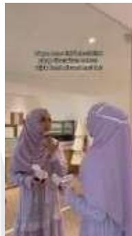
Gambar 9 Potongan Video Tiktok

Sesuai dengan target audience Cover Me, video Tiktok tersebut dibuat dengan mengusung tema perempuan, dimana ada informasi yang terdapat didalamnya. Video ini diposting di akun media sosial Tiktok Cover Me.