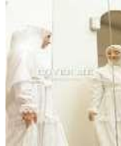
Gambar 10 Potongan Video Tiktok Teaser Produk