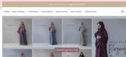
Gambar 6 Website resmi Naqa.id