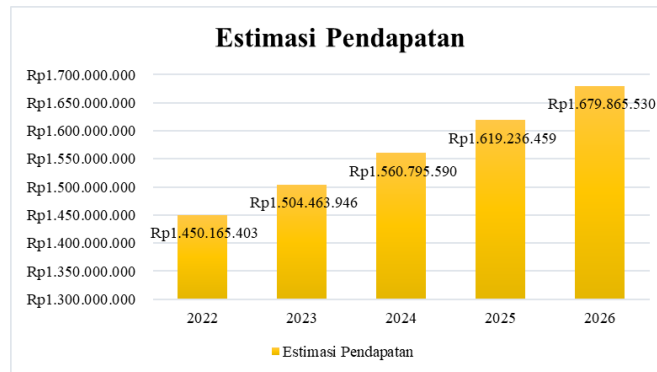
Gambar 3. Estimasi Pendapatan Cabang Toko Strawberry