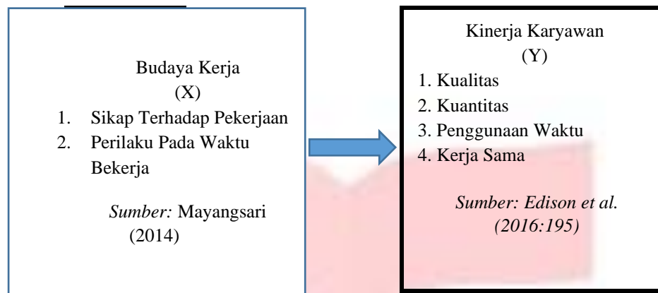
Gambar 2.1 Kerangka Pemikiran