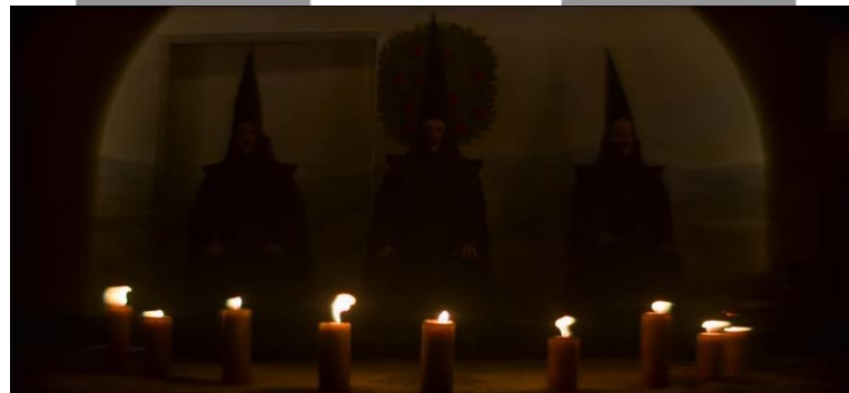
Gambar 9 Kostum Unholy Trivium

rah, rok pendek hitam, tights , dan sepatu. Kedua tangan wanita itu terlihat seperti terbakar. Dalam ruangan tersebut, terlihat ada patung di sisi kiri dan kanan. Dari segi komposisi, subjek ditempatkan di tengah frame dan pengambilan gambar dengan low angle, full shot . Dari aspek pencahayaannya, berfokus pada wajah subjek, maka dari itu, lingkungan sekitar subjek menjadi sedikit underexposed . Interpretasi visual yang ingin disampaikan dalam scene ini adalah pemilihan blouse yang berwarna merah menggambarkan keberanian karena makna dari warna merah itu sendiri sering dikaitkan dengan keberanian, kehidupan, dan kemarahan. Dari segi aksoris Crown of Thorns atau Corona de Jesus (Crown of Jesus) menurut sejarah, mahkota tersebut dikenakan Yesus dalam proses menuju penyaliban. Yesus yang merupakan anak Tuhan, dipaksa mengenakan mahkota ini sebagai bentuk ejekan atas klaim otoritasnya. Dalam konteks ini, Sabrina mengenakan mahkota ini karena Sabrina merupakan anak dari The Dark Lord . Dari segi angle kamera, low angle menggambarkan bagaimana para witch hunter tidak memiliki kekuatan yang sebanding dengan Sabrina.