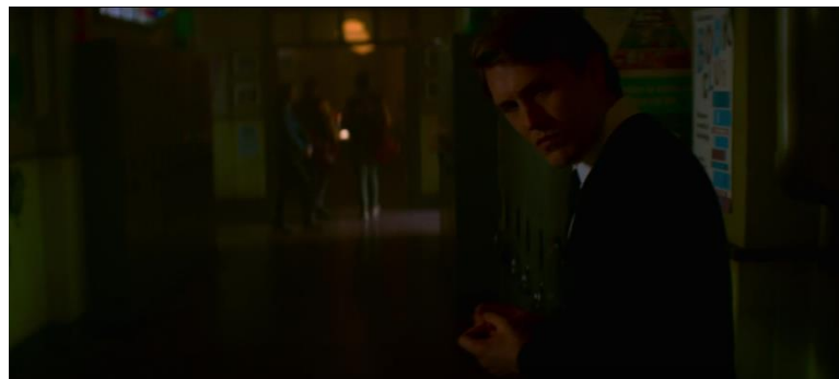
Gambar 16 Jerathmiel memata-matai Sabrina