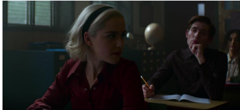
Gambar 17 Sabrina memandangi bangku kosong Sumber: Screenshot Chilling Adventure of Sabrina, 2019, Timecode: 00:12:44

Scene ini menceritakan Sabrina memandangi bangku kelas yang kosong yang biasanya ditempati oleh Roz, salah satu teman dekat Sabrina. Pertama, framing gambar dalam scene ini adalah medium close-up shot . Kedua, agle kamera yang digunakan adalah eye level . Pergerakan kamera dalam scene ini adalah zoom in .