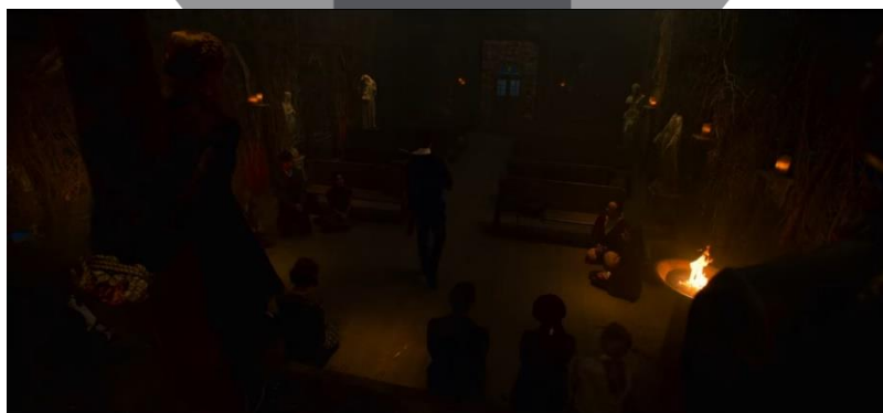
Gambar 6 Set Gedung Desecrated Church