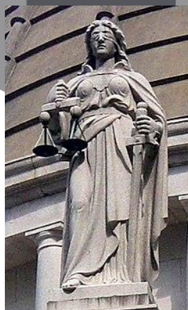
Gambar 10 Justice Statue

Dalam scene ini terlihat ada tiga manusia bermuka rusak, sedang duduk saling bersebelahan dan mengenakan pakaian serba hitam. Ketiga manusia tersebut duduk membelakangi mural sebuah pohon apel ditengah padang rumput. Di depan tiga manusia itu terdapat beberapa lilin yang menyala dan membentuk formasi setengah lingkaran. Scene ini memiliki pencahayaan yang minim. Dari sisi framing , ketiga subjek ditempatkan ditengah frame . Untuk interpretasi visual, scene ini memiliki ikatan kuat dengan mitologi Greek Underworld , yang dimana hakim dunia bawah terdiri dari tiga Dewa, yaitu Minos , Rhadamatus , dan Aeacus . Ketiga Dewa tersebut bertugas untuk menghakimi orang yang sudah meninggal namun, ketiga Dewa tersebut seperti yang direpresentasikan dalam series ini, ikut menghakimi perkara dalam dunia orang hidup, secara umum mereka bertugas sebagai hakim agung. Dua dari ketiga The Unholy Trivium ini buta, menggambarkan dalam dunia nyata, patung keadilan merupakan seorang wanita yang matanya ditutup oleh kain sambil memegang timbangan untuk menggambarkan bahwa keadilan dijunjung secara jujur tanpa adanya campur tangan dari pihak lain. Namun, karena ada salah satu anggota yang masih bisa melihat, hal ini menggambarkan penghakiman dari The Unholy Trivium masih dapat dicemari.