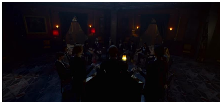
Gambar 4 Pencahayaan main hall

bangunan lain di sekitar gedung tersebut. Terlihat juga cahaya yang kuat dari belakang gedung. Untuk bentuk dari gedung tersebut itu sendiri, arsitektur dari gedung tersebut terlihat seperti di bangun pada tahun sekitar akhir 1800-an hingga awal 1900-an. Dengan pencahayaan yang terhitung underexposed , scene ini ingin memberikan kesan yang menyeramkan dan misterius kepada gedung ini.