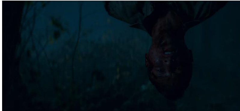
Gambar 14 Tata Rias Chalfant

manapun. Make-up di area mata yang digunakan kepada The Unholy Trivium menggambarkan bagaimana matanya dikeluarkan dan kelopak matanya dijahit secara tidak sempurna. Pencahayaan dalam scene ini juga membuat prosthetic make-up yang digunakan menjadi terlihat lebih kuat.