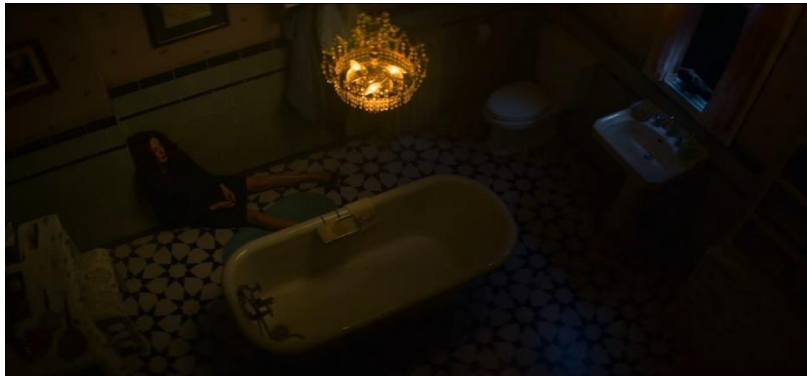
Gambar 6 Set Kamar Mandi Rumah Lilith (Wardwel)

yang tidak memiliki kepala menggambarkan bagaimana Faustus (kepal sekolah Academy of Unseen Arts ) yang menentang feminisme dan bagaimana menurutnya hanya wanita tidak layak menjadi pemimpin.