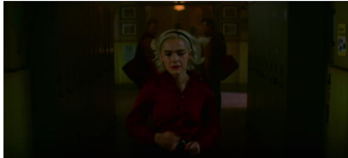
Gambar 15 Sabrina berlari terburu-buru