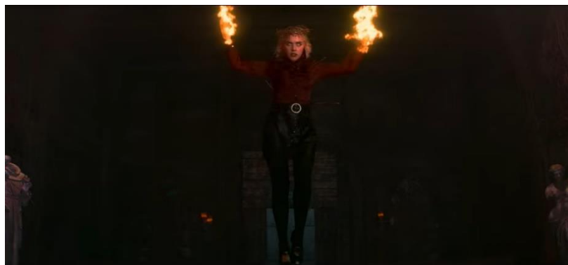
Gambar 87 Kostum Sabrina