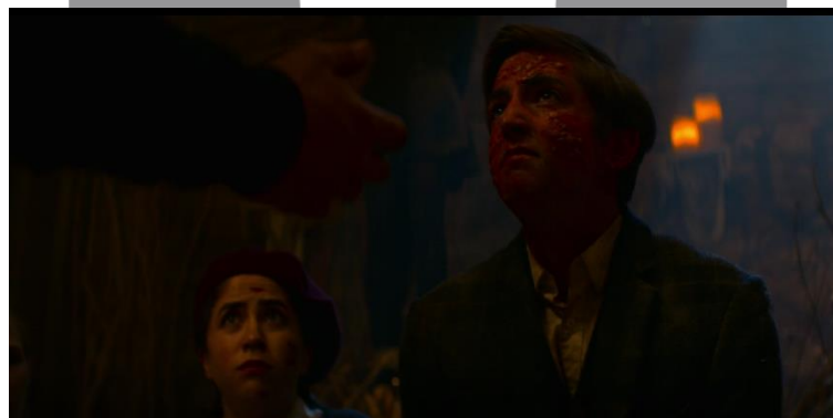
Gambar 12 Tata Rias Melvin