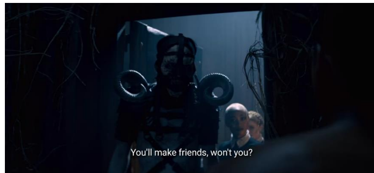
Gambar 11 Kostum Infernal Bailiff

Untuk bentuk penutup kepala, peneliti tidak dapat menemukan sumber yang terpercaya namun, menurut peneliti secara pribadi, bentuk penutup kepala ini mengambil referensi dari seragam milik kelompok ekstrimis KKK ( Ku Klux Klan ).