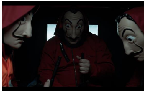
Gambar 1. Adegan menit 12:08-12:19

Denotasi yang terlihat pada potongan gambar ini terlihat ketiga anggota perampok berada didalam sebuah mobil van untuk melancarkan aksinya di Royal Mint of Spain mereka sedang menunduk, memegang kuat senjata masing-masing, dan memakai topeng Dali. Berdasarkan makna konotasi, perlakuan anggota kelompok tersebut sedang diam menunduk, dan memegang kuat senjata masing-masing, menggambarkan sebuah bentuk kesiapan mereka untuk mencapai tujuannya, yaitu bersiap merampok dipercetakan uang. Dalam scene ini juga terlihat setting yang menggambarkan keadaan yang menakutkan karena gelap nya kondisi cahaya di dalam truk tersebut. Berdasarkan makna mitos dalam hal ini menggambarkan bahwa mereka sedang fokus dan serius. Didukung dengan kekompakan seragam jumpsuit merah mereka dan topeng wajah Dali yang digunakan bersamaan, menandakan mereka kelompok yang misterius.