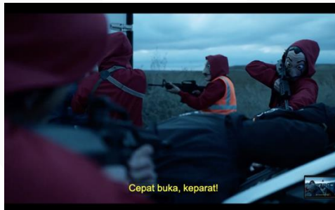
Gambar 4. Adegan menit 15:27-15:30