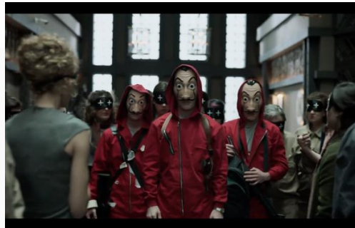
Gambar 6. Adegan menit 15:33-15:41