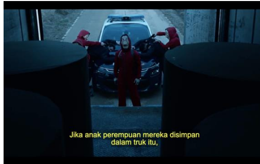
Gambar 5. Adegan menit 15:33-15:41