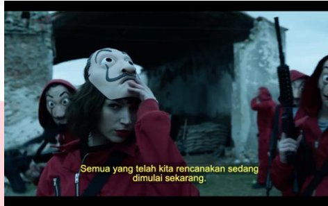
Gambar 3. Adegan menit 14:07-14:13