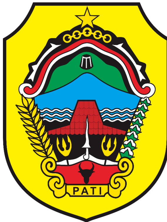
Logo Kabupaten Pati