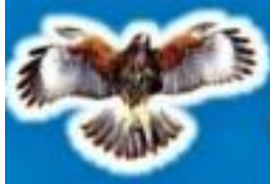
Gambar 1. 1 Logo Roti Kacang Rajawali

gampang diingat dan populer. Burung rajawali juga besar. Berikut merupakan logo Roti Kacang Rajawali pada gambar 1.1