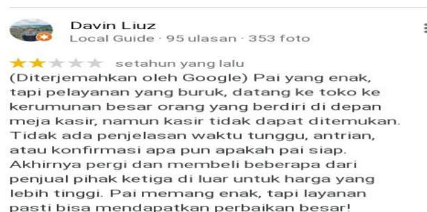
Gambar 1. 9 Review Konsumen Roti Kacang Rajawali Tebing Tinggi

Kemudian pada kepuasan konsumen terlihat adanya keluhan konsumen yaitu pada dimensi Kualitas Pelayanan, konsumen merasa tidak puas dengan pelayanan yang diberikan karena tidak adanya penjelasan waktu tunggu ditengah antrian yang begitu banyak, konsumen membutuhkan konfirmasi mengenai produk yang telah dipesan namun kasir tidak dapat ditemukan akhirnya konsumen memilih untuk pergi meninggalkan tokoh.