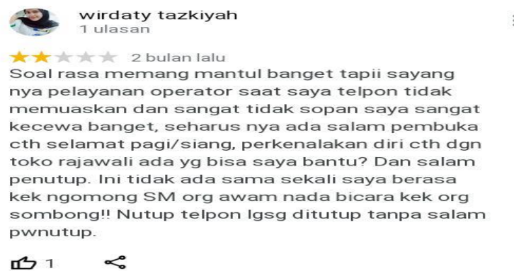
Gambar 1. 5 Review Konsumen Roti Kacang Rajawali Tebing Tinggi

Kemudian pada dimensi Serviceability ,terdapat adanya keluhan konsumen mengenai pelayanan operator melalui telepon yang tidak sopan sehingga konsumen tidak mendapatkan informasi yang di butuhkan karena sikap pelayanan yang tidak memuaskan membuat konsumen kecewa.