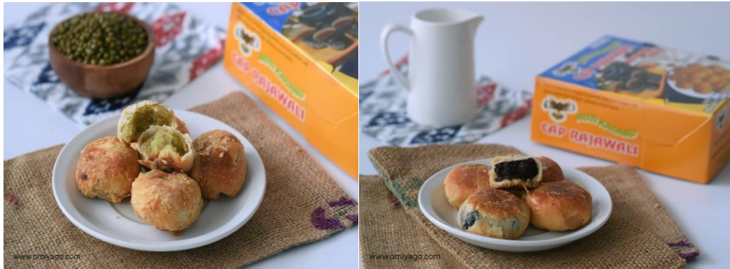
Gambar 1. 2 Produk Roti Kacang Rajawali

Roti Kacang Rajawali juga menawarkan produk dengan berbagai macam varian rasa seperti kacang hijau, kacang hitam/merah, Jeruk kesturi, Asin manis, Nenas dan durian serta yang masih direncanakan akan menambah rasa keju dan coklat. Semua dijual dengan berbagai macam ukuran dan isi . Ukuran yang ditawarkan sedang isi 21 pcs, besar isi 27 psc, tergantung dari pesanan konsumen. Berikut merupakan gambar produk yang ditawarkan oleh Roti Kacang Rajawali, seperti di bawah ini :