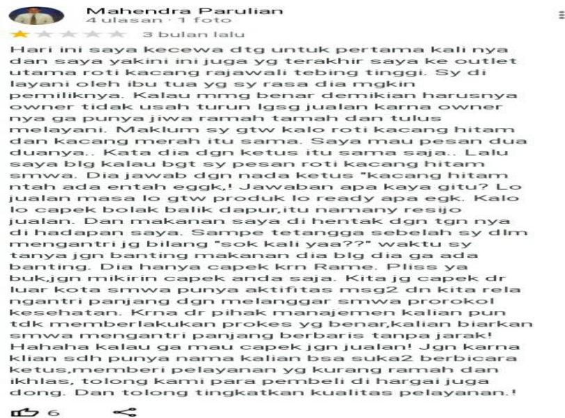
Gambar 1. 6 Konsumen Roti Kacang Rajawali Tebing Tinggi