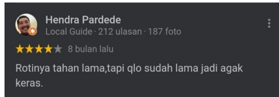
Gambar 1. 4 Review Konsumen Roti Kacang Rajawali Tebing Tinggi