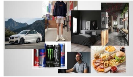
Gambar 2 .Mood Board