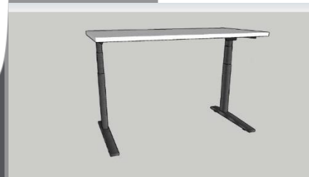
Gambar 4 .Desain Final