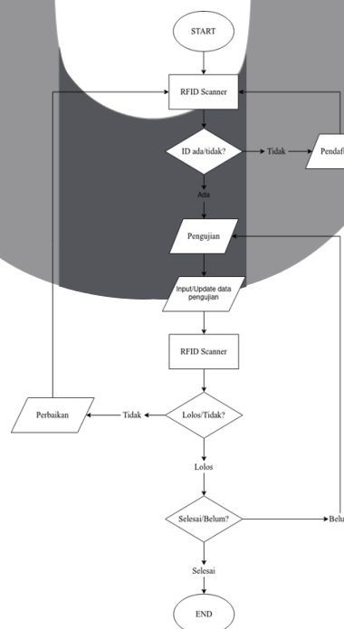
Gambar 3.2. Flowchart sistem yang dibuat.

Untuk mengatasi masalah duplikasi data maka pemetaan ID untuk setiap datanya pada blockchain akan menggunakan ID dari RFID tag yang terdapat pada kendaraan tersebut. Jika pemilik kendaraan mengalami masalah seperti tidak lulus pada tahapan uji KIR atau ID dari RFID kendaraan tidak terdaftar pada blockchain database, maka pemilik kendaraan tersebut akan diminta untuk melengkapi segala kekurangannya di bagian Administrasi, dan jika kendaraan tersebut sebelumnya tidak lulus dalam salah satu tahapan uji KIR, maka kendaraan tersebut harus mengulang dari tahapan awal pengujian, dan data uji yang sebelumnya akan digantikan atau diisikan oleh sistem menjadi null dan dinyatakan tidak lulus uji KIR. Untuk lebih jelas dalam pemahaman alur sistem yang akan dibuat, dapat memperhatikan Gambar 3.2.