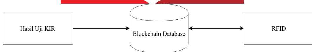
Gambar 3.1. Diagram blok dari rancangan sistem.

Secara garis besar sistem yang akan dibuat adalah, perangkat IoT RFID reader akan membaca RFID yang sudah ditempelkan pada kendaraan, dan mengirimkan ID dari RFID tersebut ke dalam blockchain database, jika ID tersebut tersedia maka blockchain akan mengirimkan sinyal kepada RFID untuk menyatakan bahwa data dari RFID tersebut tersedia dan dapat melakukan tahapan uji KIR. Jika ID dari RFID itu tidak tersedia maka pemilik kendaraan diharapkan untuk melakukan pendaftaran terlebih dahulu pada bagian Administrasi. Hasil uji KIR nanti akan dikirimkan ke dalam blockchain database untuk dilakukan verifikasi dan update data. Dikarenakan uji KIR terdapat beberapa tahap, maka setiap kendaraan selesai melakukan uji KIR pada satu tahap, untuk dapat melanjutkan ke tahapan selanjutnya, RFID dari kendaraan tersebut akan dibaca ulang oleh RFID reader untuk memastikan bahwa kendaraan tersebut sudah lulus uji tahap tersebut. Jika kendaraan dinyatakan lulus tahap tersebut, maka kendaraan dapat melanjutkan ke tahap selanjutnya. Sedangkan, jika kendaraan tidak lulus dari tahapan tersebut, maka pemilik kendaraan diminta untuk melakukan perbaikan, dan proses uji KIR akan berakhir. Untuk lebih jelasnya dapat memperhatikan Gambar 3.1.