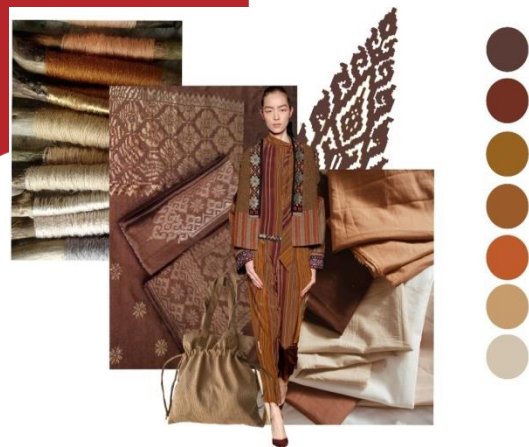
Gambar 5. Imageboard Sumber: Dokumentasi pribadi, 2021 )

Konsep yang saya ambil yaitu Modern Ethnic Style , gaya yang berkembang dari konsep minimalis dengan tambahan etnik. Gaya dengan desain modern dengan tambahan unsur tradisional. Gaya desain yang fungsional, simpel dan kontemporer. Warna yang dipilih yaitu warna-warna earth tone untuk mendeskripsikan gaya desain yang minimalis. Konsep Modern Ethnic Style juga diadaptasi dari bentuk penyederhanaan pada motif tenun yang simple .