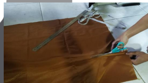
Gambar 8. Pembuatan pola dan menggunting tas