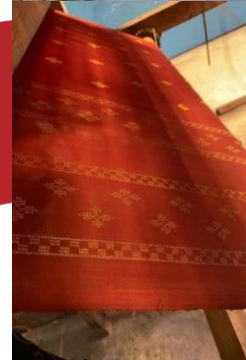
Gambar 12. Pembuatan tenun