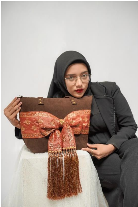
Gambar 21. Hasil produk 1