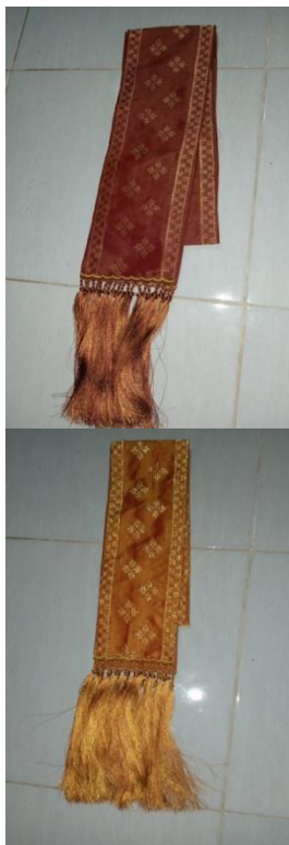
Gambar 15. Selendang tenun