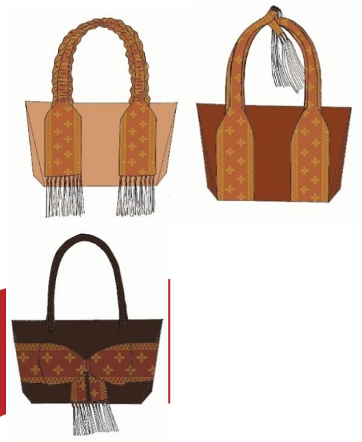
Gambar 7. Sketsa produk

Proses pembuatan sketsa produk dilakukan tracing secara manual lalu dirapikan dalam digital menggunakan aplikasi adobe photoshop , dari pembuatan motif, pembuatan desain produk tas dan pewarnaan.