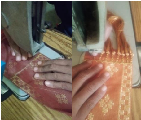
Gambar 14. Bordir dan rumbai