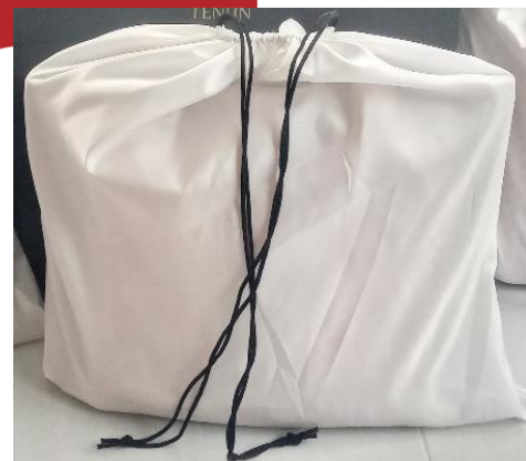
Gambar 19. Merchandise

Konsep merchandise yang akan digunakan yaitu konsep yang simple , elegan dan eksklusif . Material yang digunakan untuk pembungkus tas dalam memakai material satin putih dengan bentuk tas serut kotak menyesuaikan dengan ukuran tas. Pertimbangan menggunakan material tersebut adalah satin memiliki tekstur yang licin dan mengkilap sehingga produk tas yang menggunakan aplikasi imbuhan payet lebih aman dari gesekan dan goresan kain, selain itu juga kain satin memberikan kesan mewah. Material bahan yang digunakan untuk packaging adalah berbahan kertas dengan desain yang sama dengan packaging untuk produk lainnya pada UMKM Tenun Bu Atun.