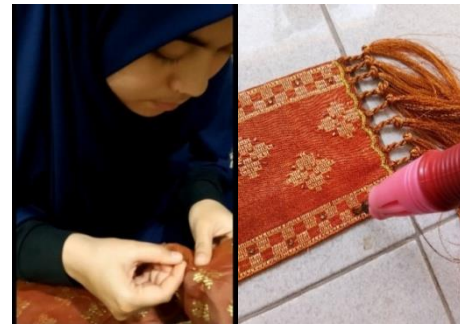
Gambar 16. Pemasangan payet