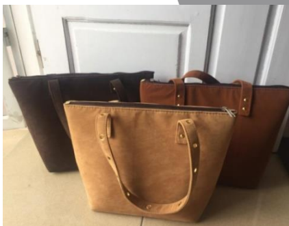
Gambar 11. Produk tas