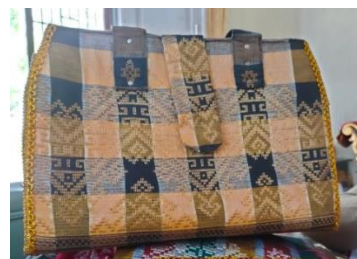
Gambar 4. Hasil produk tote bag