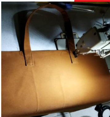
Gambar 10. Menjahit tali tas dan sisi tas