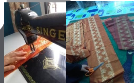
Gambar 13. Pembuatan selendang Sumber: Dokumentasi pribadi, 2021