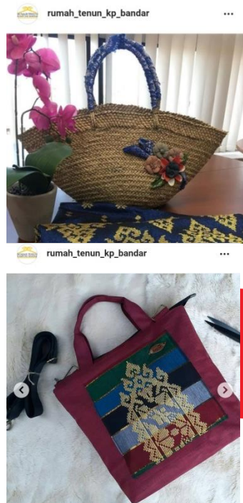
Gambar 2. Produk tas Rumah Tenun Kampung Bandar