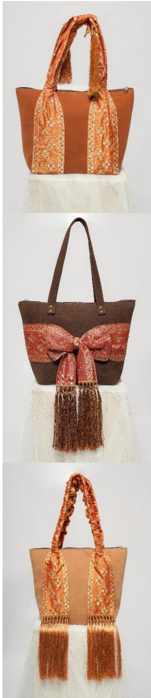
Gambar 18. Hasil produk

Konsep merchandise yang akan digunakan yaitu konsep yang simple , elegan dan eksklusif . Material yang digunakan untuk pembungkus tas dalam memakai material satin putih dengan bentuk tas serut kotak menyesuaikan dengan ukuran tas. Pertimbangan menggunakan material tersebut adalah satin memiliki tekstur yang licin dan mengkilap sehingga produk tas yang menggunakan aplikasi imbuhan payet lebih aman dari gesekan dan goresan kain, selain itu juga kain satin memberikan kesan mewah. Material bahan yang digunakan untuk packaging adalah berbahan kertas dengan desain yang sama dengan packaging untuk produk lainnya pada UMKM Tenun Bu Atun.