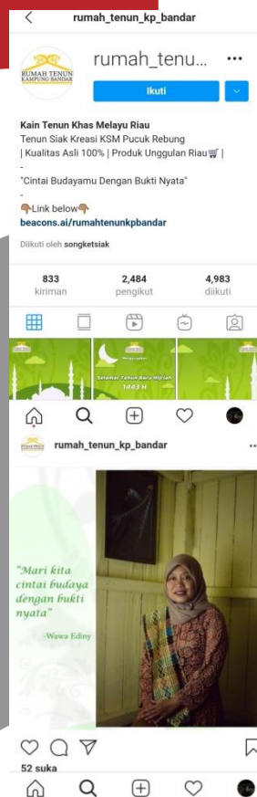
Gambar 1. Akun instagram dan foto pemilikRumahTenun