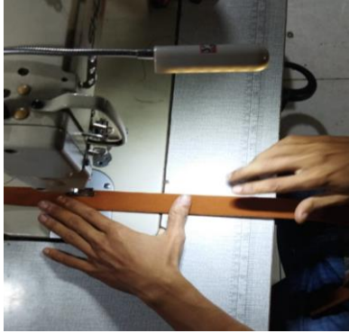
Gambar 9. Menjahit tali tas