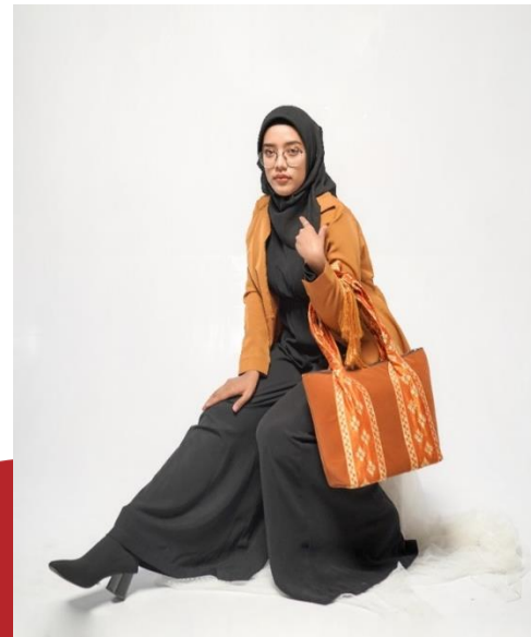
Gambar IV.1 Hasil produk 3