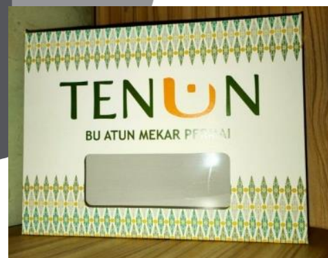
Gambar 20. Merchandise