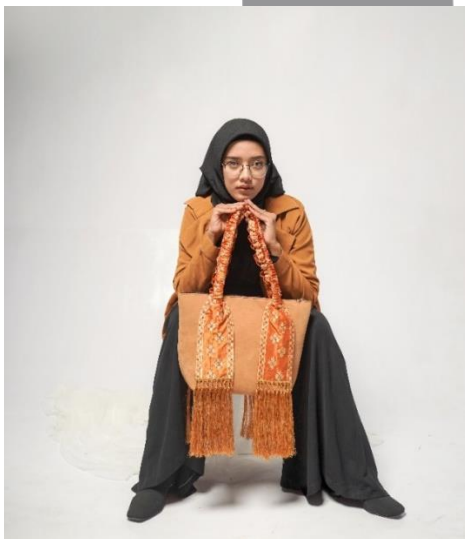
Gambar 22. Hasil produk 2