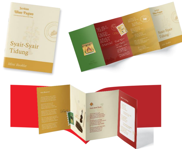
Gambar 7. Mini Booklet