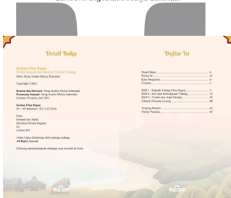
Gambar 2. Detail Buku