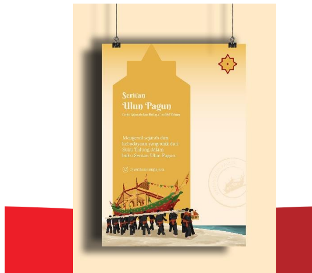
Gambar 5. Poster