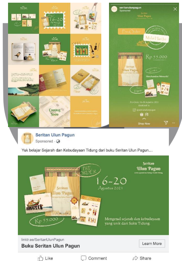
Gambar 6. Media Sosial