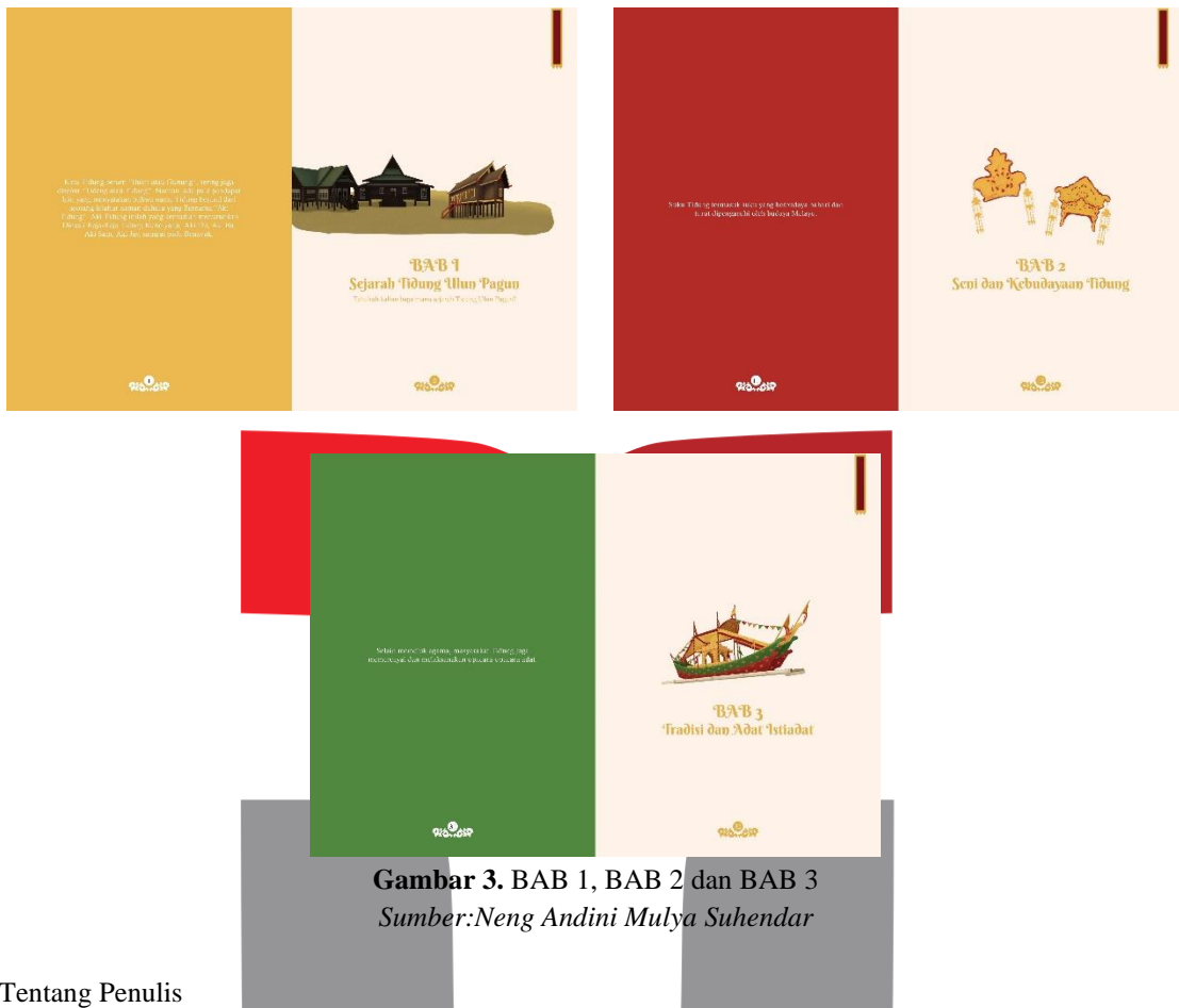
Gambar 3. BAB 1, BAB 2 dan BAB 3