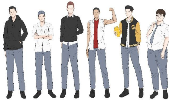
Gambar 4. (hasil pembuatan karakter desain)