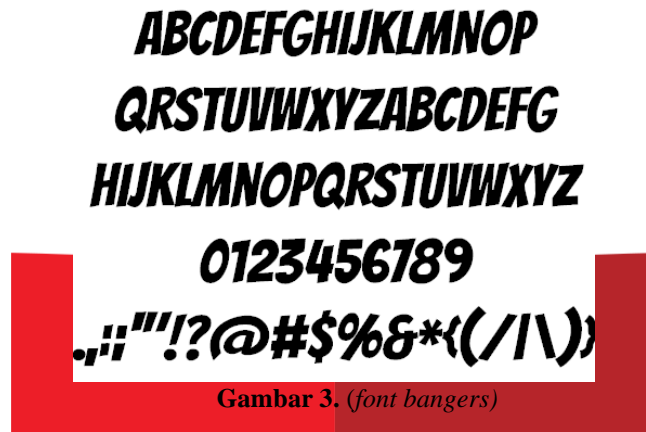
Gambar 3. (font bangers)

Sedangkan efek tulisan pada komik biasanya diletakkan pada dalam gambar pada panel dengan tujuan membantu menerjemahkan adegan pada komik. Karakter font yang digunakan berupa jenis yang tebal dan besar dengan maksud memberikan kesan lebih dramatis dan dapat terlihat di dalam panel. Jenis font yang digunakan jenis sans serif “Bangers”.