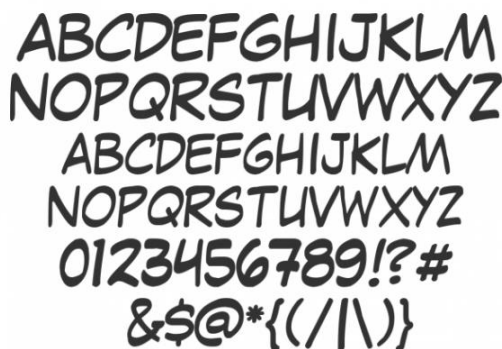
Gambar 2. (font sans serif " lafayette comic pro ")

Penggunaan font pada komik di gunakan pada balon komik sebagai teks dialog dan narasi dalam cerita. dari hasil analisis yang didapat disimpulkan font yang sesuai dengan komik merupakan berjenis sans serif " Lafayette Comic Pro " karena sesuai dan memiliki karakter yang sering digunakan pada komikus dalam membuat komik.