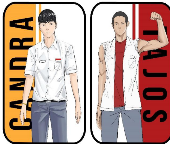
Gambar 10. (desain gantungan kunci)