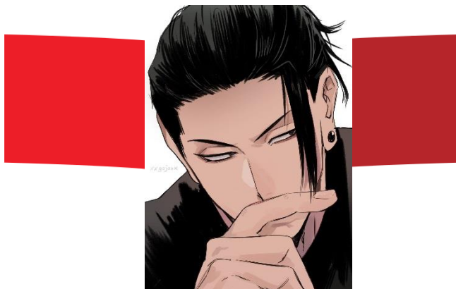
Gambar 1. (contoh visual gambar penggambaran semi realis dan pewarnaan cell shading )

Konsep pada warna yang diberikan komik berwarna pada karakter yang diberikan, teknik pewarnaan cell shading juga digunakan untuk memberikan volume pada gambar lebih efisien dan jelas, dan pemberian warna hitam sebagai penegas pada gambar.