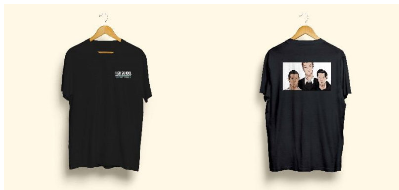
Gambar 7. (desain kaos hitam)