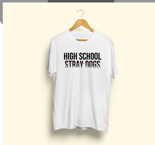
Gambar 8. (desain kaos putih)