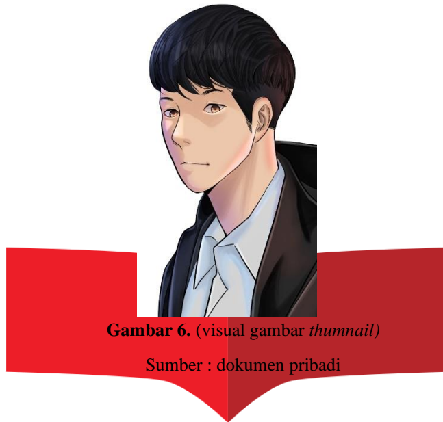
Gambar 6. (visual gambar thumbnail )