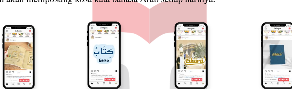
Gambar 3.11 Desain Media Sosial Cibara

Sosial media digunakan untuk memposting mengenai board game Cibara, kemudian di Instagram akan memposting kosa kata bahasa Arab setiap harinya.