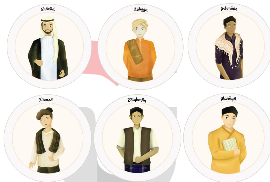
Gambar 3.2 Ilustrasi Karakter Santri

Karakter yang digunakan pada board game ini mengacu pada karakter santri Ar-Rahman Qur'anic College sehingga hanya dibuat karakter untuk santri laki-laki saja. Penggambaran karakter dibuat dengan gaya kartun tetapi tetap memperlihatkan bahwa ini adalah karakter dari pria remaja, dan dipakaikan pakaian seperti baju koko, jubah, sarung, agar lebih menggambarkan bahwa ini adalah santri.