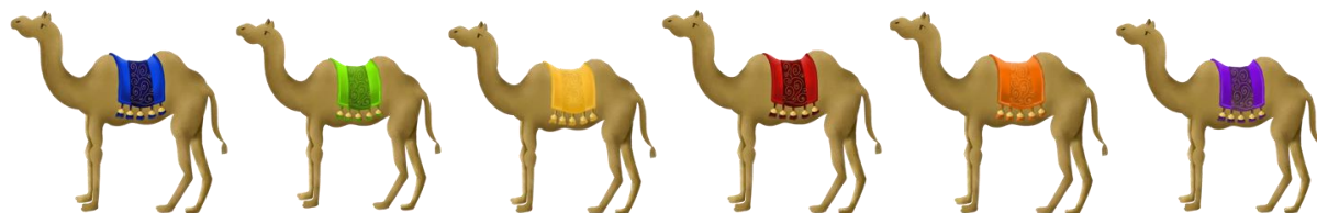
Gambar 3.7 Pion

Pion yang digunakan pada permainan ini adalah pion berbentuk unta yang akan di cetak menggunakan acrylic. Pion ini yang akan menjadi penanda letak para pemain serta berjalannya pemain dari tile satu ke tile yang lainnya.