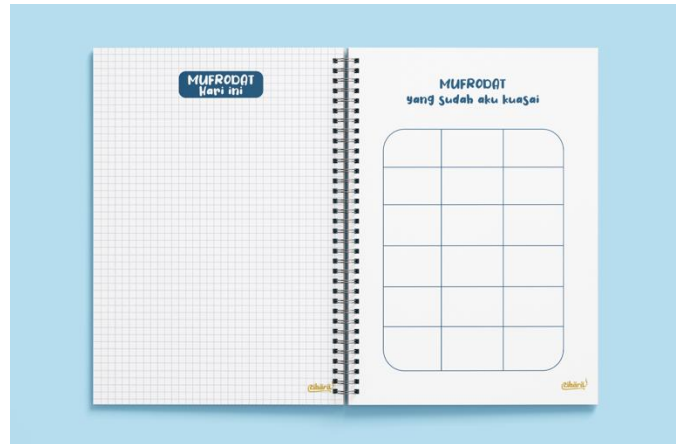
Gambar 3.10 Desain Notebook Cibara