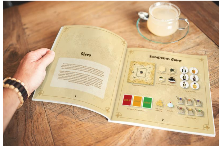
Gambar 3.8 Rules Book Board Game Cibara

Rules Book berisi mengenai petunjuk dan penjelasan permainan dengan detail komponen-komponen yang disediakan oleh board game. Rules book ini terdiri dari beberapa halaman dengan ukuran 20x20 cm.