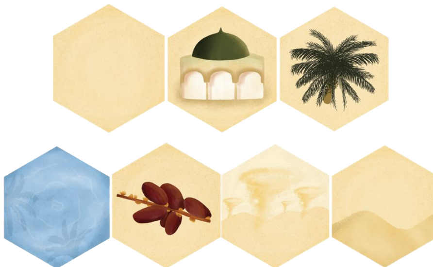
Gambar 3.6 Tile

Pada balik tile masing-masingnya terdapat gambar seperti mata air, kurma, badai pasir, dan juga pasir hisap berikut penjelasan masing-masingnya jika mendapatkan gambar-gambar berikut pada balik tile: