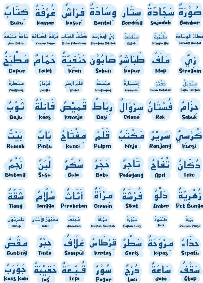
Gambar 3.9 Desain Sticker Kosakata