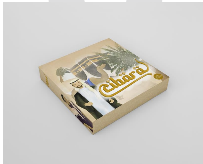
Gambar 3.8 Packaging Board Game Cibara

Packaging yang digunakan untuk mengemas board game ini berbentuk persegi dengan ukuran 30x30 cm.