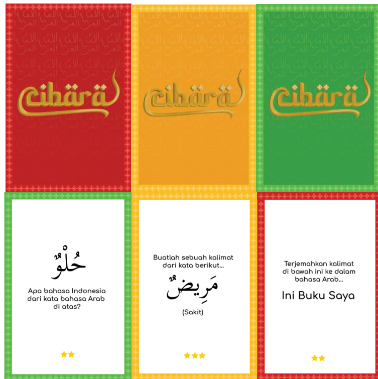
Gambar 3.3 Kartu Pertanyaan