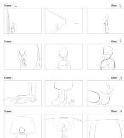
Gambar 1. Sampel Thumbnail

Thumbnail adalah proses dalam pembuatan eksplorasi visual setiap adegan yang telah terbagi pada naskah cerita. Setiap adegan akan terbagi menjadi tiga alternatif gambar yang setelah itu dipilih dengan kesesuaian konsep.