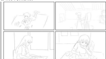
Gambar 2. Sampel Rough pass

Pada tahapan ini, Storyboard Artist membuat sebuah sketsa kasar yang telah memiliki elemen – elemen visual yaitu type shot , angle shot , serta camera movement .