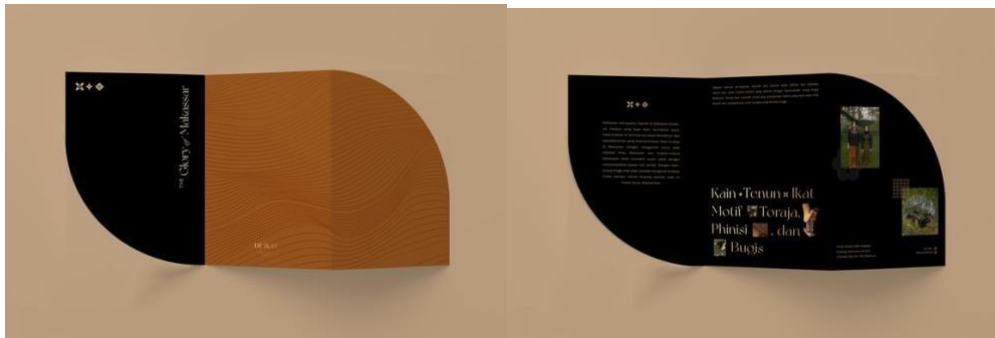
Gambar 6.(f) Hasil Perancangan Brosur

Selain menggunakan media sosial sebagai media utama dalam mempromosikan produknya, brosur juga dapat menarik perhatian target sasarannya. Brosur yang berfungsi sebagai media pendukung akan disebar kepada para calon konsumennya khususnya pada saat event tertentu seperti pameran. Pada brosur ini akan tercantum beberapa informasi mengenai usaha dan produknya. Pada brosur ini, menggunakan jenis brosur trifold dengan ukuran A5 yang menggunakan material fancy paper . Beberapa tulisan yang dengan huruf berwarna emas akan menggunakan finishing foil dan pada cover akan dilakukan penekanan pada motif dengan menggunakan teknik finishing emboss .