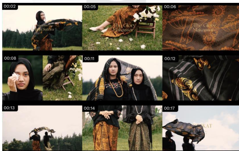
Gambar 5.(e) Hasil Perancangan Video Promosi pada Instagram