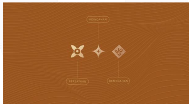
Gambar 2.(b) Elemen Grafis

Pada konsep fotografi akan mengusung konsep nature , cultural , warmth . Konsep ini dipakai karena menyesuaikan dengan produk dan juga citra perusahaannya. Sedangkan untuk ilustrasi akan menggunakan berupa elemen dekoratif yang akan menjadi elemen pendukung dari layout . Elemen dekoratif yang digunakan diambil dari motif kain tenun sutera De.Ikat by Arni Kurnia. Makna yang terkandung dalam corak-corak ini melambangkan lingkungan hidup dan alam sekitar dengan tujuan untuk memperkenalkan serta melestarikan kain sutera. Elemen yang terpilih memiliki makna yang terkait dengan budaya yang menjunjung tinggi adat istiadat yang sesuai dengan value dari De.Ikat by Arni Kurnia.