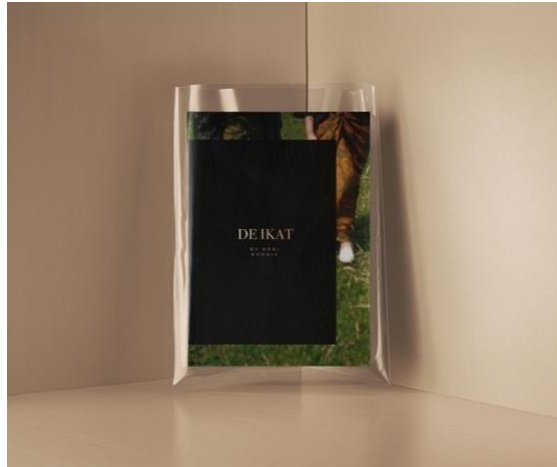
Gambar 10. (j) Hasil Perancangan Katalog

Untuk dapat menjangkau target pasarnya lebih luas, dibutuhkan stationary set yang dapat merepresentasikan citra usahanya. Selain untuk memperkenalkan citra usahanya, stationary set juga dapat sebagai pengingat kepada konsumen akan usahanya. Pada perancangan stationary set terdiri dari kartu nama, amplop, hang tag , dan thankyou card . Material yang digunakan yaitu Art Paper dengan finishing emboss dan juga gold foil . Kartu nama dengan ukuran 9 x 5,5 cm, amplop, thankyou card dengan ukuran A5 dan hang tag dengan ukuran 6,5 x 12,7 cm.