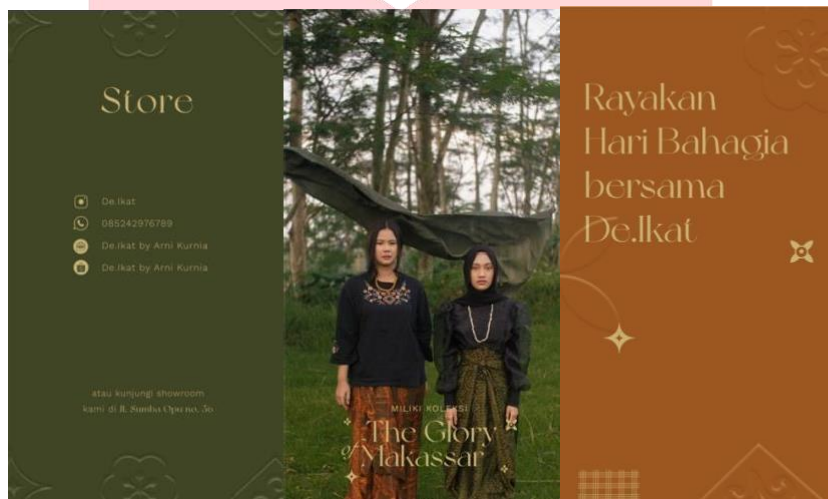
Gambar 4.(d) Hasil Perancangan Instagram Story Sumber : Pribadi