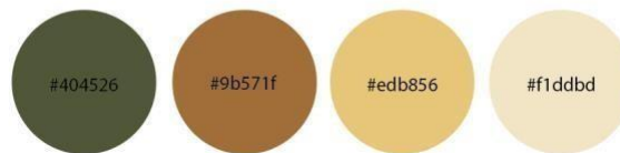
Gambar 1.(a) Warna

Pada konsep fotografi akan mengusung konsep nature , cultural , warmth . Konsep ini dipakai karena menyesuaikan dengan produk dan juga citra perusahaannya. Sedangkan untuk ilustrasi akan menggunakan berupa elemen dekoratif yang akan menjadi elemen pendukung dari layout . Elemen dekoratif yang digunakan diambil dari motif kain tenun sutera De.Ikat by Arni Kurnia. Makna yang terkandung dalam corak-corak ini melambangkan lingkungan hidup dan alam sekitar dengan tujuan untuk memperkenalkan serta melestarikan kain sutera. Elemen yang terpilih memiliki makna yang terkait dengan budaya yang menjunjung tinggi adat istiadat yang sesuai dengan value dari De.Ikat by Arni Kurnia.