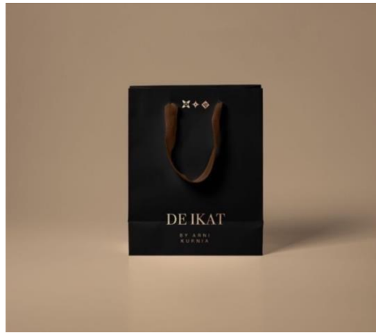
Gambar 8. (h) Hasil Perancangan Paper Bag

Untuk dapat menambah keinginan konsumen untuk membeli produk, katalog berfungsi untuk diberikan kepada calon konsumennya agar informasi mengenai produk De.Ikat by Arni Kurnia tersampaikan dengan jelas. Pada katalog ini berisi koleksi produk-produk De.Ikat by Arni Kurnia beserta keterangan informasi produk seperti jenis dan harga agar dapat membantu calon konsumen untuk memilih dan melihat produk dengan jelas dan lengkap. Katalog ini tersedia dalam bentuk media daring dan juga luring. Ukuran yang digunakan pada katalog yaitu A4 dengan material art carton untuk cover dan juga art paper .