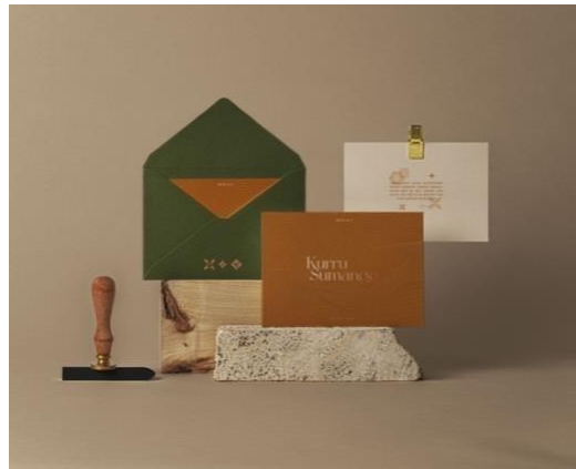
Gambar 12. (l) Hasil Perancangan Thankyou Card