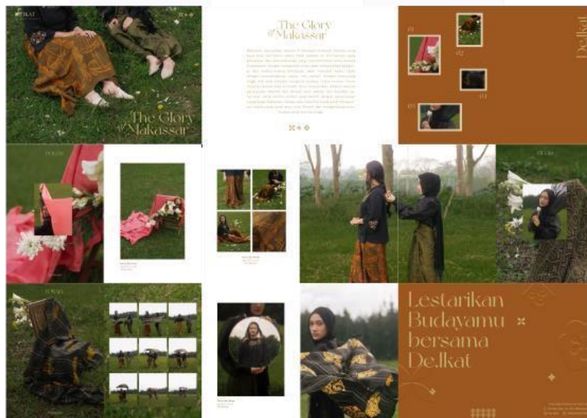
Gambar 9. (i) Hasil Perancangan E-Katalog

Untuk dapat menambah keinginan konsumen untuk membeli produk, katalog berfungsi untuk diberikan kepada calon konsumennya agar informasi mengenai produk De.Ikat by Arni Kurnia tersampaikan dengan jelas. Pada katalog ini berisi koleksi produk-produk De.Ikat by Arni Kurnia beserta keterangan informasi produk seperti jenis dan harga agar dapat membantu calon konsumen untuk memilih dan melihat produk dengan jelas dan lengkap. Katalog ini tersedia dalam bentuk media daring dan juga luring. Ukuran yang digunakan pada katalog yaitu A4 dengan material art carton untuk cover dan juga art paper .