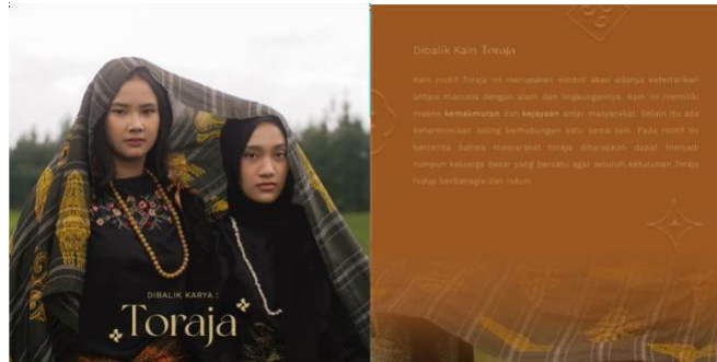
Gambar 3.(c) Hasil Perancangan Instagram Feeds