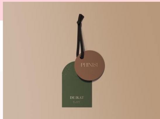
Gambar 13. (m) Hasil Perancangan Hang Tag