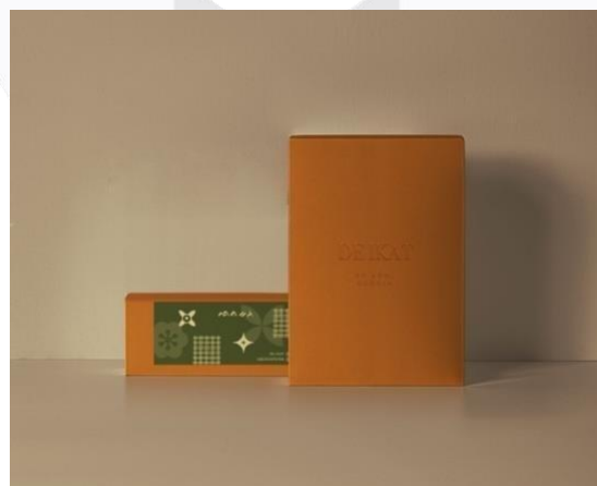
Gambar 7. (g) Hasil Perancangan Box Kemasan

Salah satu faktor yang dapat menarik perhatian konsumen yaitu kemasan. Pada kemasan De.Ikat by Arni Kurnia terdapat 2 tipe yaitu dengan box dan juga paper bag . Untuk kemasan box akan digunakan untuk transaksi via online sedangkan paper bag untuk pembelian via offline /toko. Pada box berukuran 20 x 10 x 5 cm akan menggunakan material hard box dengan finishing emboss pada logo. Penggunaan material hardbox berupa duplex yang dilapisi dengan kertas jasmine agar terlihat eksklusif, tahan banting dan juga dapat menambah nilai produk. Pada hardbox terdapat sticker sebagai sealed yang memiliki motif identitas dari produk De.Ikat by Arni Kurnia. Sedangkan untuk paper bag dengan ukuran 35 x 25 x 9 cm akan menggunakan material kertas ivory .