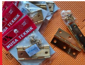
Gambar 9. Engsel