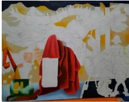
Gambar 20. Proses pengkaryaan