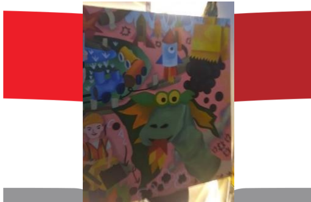
Gambar 13. Proses pengkaryaan