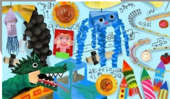
Gambar 22 Sketsa karya 140x80 cm