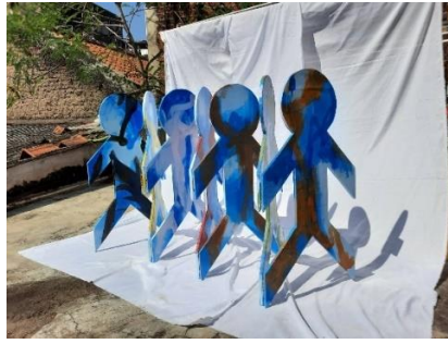
Gambar 43. DIY the Identity #6 Variable Dimension

Multiplex, Wood Filler, Enamel Paint, Spray Varnish, Stainless Steel Hinge