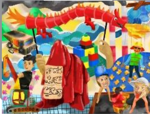
Gambar 18. Sketsa karya 90x120 cm