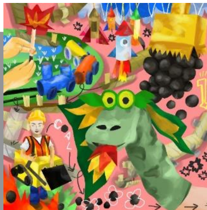
Gambar 10. Sketsa karya 100x100 cm