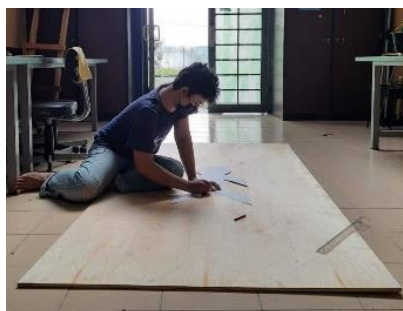
Gambar 31. Proses pengkaryaan