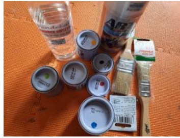
Gambar 8. cat enamel, thinner, varnish dan kuas