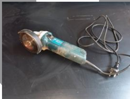
Gambar 6. Gerinda tangan untuk memotong