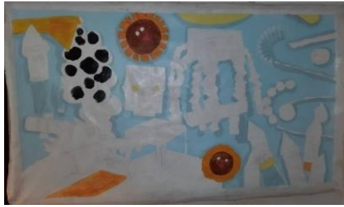
Gambar 24. Proses pengkaryaan