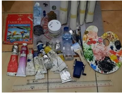
Gambar 4. Kanvas, cat minyak, linseed oil, gesso, pensil warna, kuas, palet, tiner, penggaris sebagai media pembuatan karya