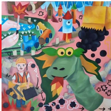
Gambar 38. DIY the Identity #1 100x100 cm Oil on Canvas