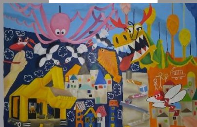
Gambar 42. DIY the Identity #5

Karya DIY the Identity #4 memiliki konsep sebuah dinding yang dipenuhi permainan dengan menyangkut kehidupan keluarga penulis secara personal. Representasi mainan gurita kertas biru, mainan cumi-cumi ungu, mainan bunga matahari sebagai simbol dari motif songket bungo cino . Representasi mainan roket sebagai simbol dari motif songket pucuk rebung . Visual mainan tabung, potongan botol plastik dan paku-pakuan sebagai simbol proses pada stone crusher batubara sehingga menjadi batuan yang lebih kecil. Visual balon hitam sebagai simbol batubara yang baru digali dengan excavator lalu diangkat dengan truk khusus pertambangan. Visual kerajinan tangan kertas bentuk kepala lengkap sebagai simbol seseorang dari Belanda yang pernah tinggal di wilayah rumah nenek penulis dan nenek penulis sempat bekerja dengannya sebagai buruh cuci. Coretan hitam mewakili penulis secara personal dengan menuliskan nama keluarga penulis termasuk penulis, alfabet yang penulis hafalkan melalui coretan di setiap sudut dinding rumah.