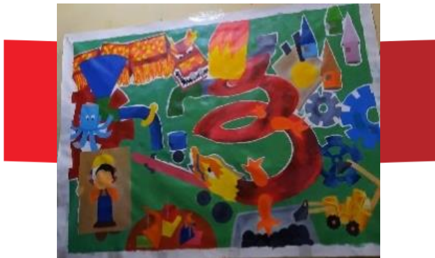
Gambar 17. Proses pengkaryaan