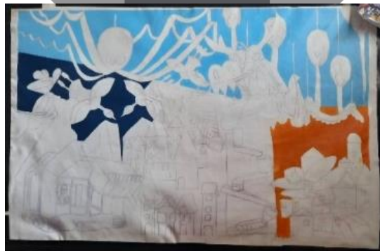
Gambar 27. Proses pengkaryaan