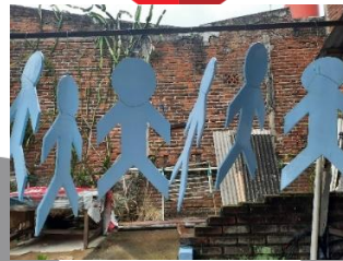
Gambar 34. Proses pengkaryaan