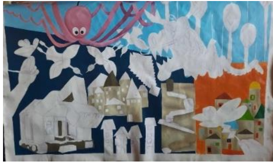
Gambar 28. Proses pengkaryaan