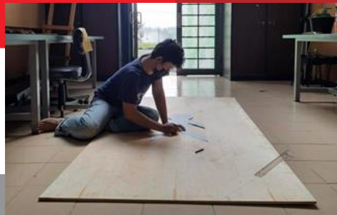
Gambar 5. Multiplek sebagai media utama

Pengkaryaan tiga dimensi pada sketsa karya terakhir dibuat dengan media multiplek ketebalan 15 mm, dempul, cat enamel, tiner, amplas, gerinda tangan, engsel 2,5 inch dan kuas.