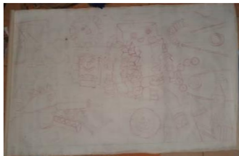
Gambar 23. Proses pengkaryaan Sumber: Dokumentasi pribadi 2021