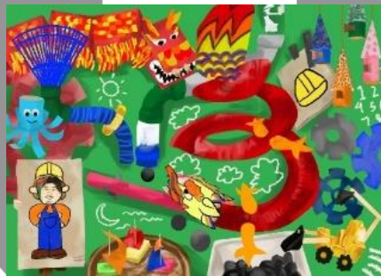
Gambar 14. Sketsa karya 100 x 140 cm