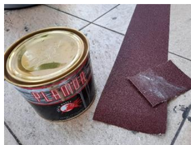
Gambar 7. Dempul kayu dan amplas