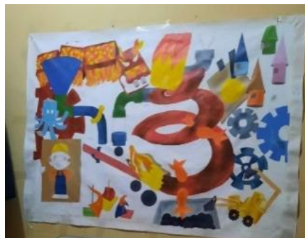
Gambar 15. Proses pengkaryaan