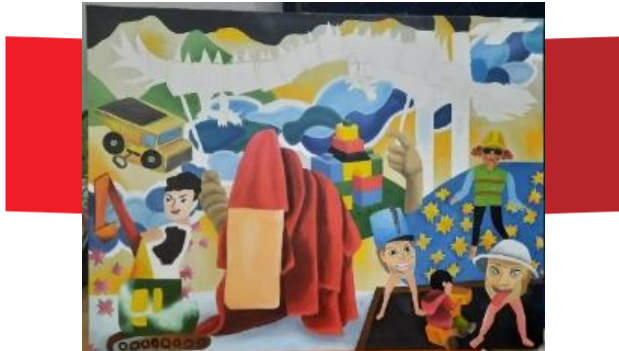
Gambar 21. Proses pengkaryaan