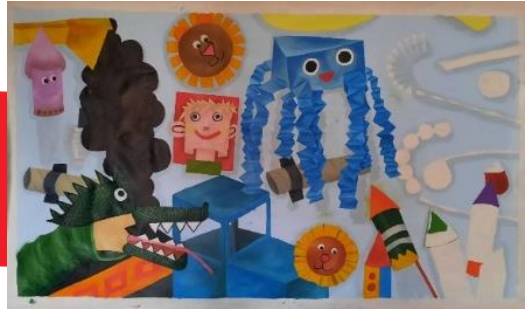
Gambar 25. proses pengkaryaan