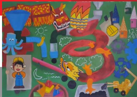
Gambar 40. DIY the Identity #3 140x100 cm Oil on Canvas

DIY the Identity #2 berkonsep sebuah panggung pementasan drama yang telah diisi pemain dan latar. Menampilkan representatif kain songket yang umum dijumpai berwarna merah dengan membawa peta ma-huan yang secara garis besar menampilkan wilayah yang saat ini adalah Sumatera Selatan dan Bangka Belitung. Motif songket nago besaung ditampilkan pada permainan naga yang dipegang dua tangan, motif songket bungo cino disimbolkan dengan potongan tidak simetris berwarna kuning dan ungu, objek gapura Sriwijaya yang tersebar di Lawang Kidul disimbolkan dengan mainan label Lego. Excavator yang digunakan dalam penambangan batubara disimbolkan dengan mainan versi gerakan tangan, pertambangan batubara disimbolkan dengan sebuah bak bagai bak pasir yang sedang dimainkan seorang anak dengan mainan dozer roda disertai dua tokoh berkepala dengan kaki yang menyimbolkan Belanda yang mengawali kegiatan pertambangan batubara di Lawang Kidul. Objek boneka kayu yang menyimbolkan penambang dengan seragamnya. Latar dengan objek oval tidak beraturan dan warna biru variatif sebagai ekosistem sungai yang melintasi wilayah Lawang Kidul, dua garis putih dan merah dengan warna hitam di atasnya sebagai simbol pembangkit listrik yang dikendarai oleh batubara dan objek hijau segitiga tidak bersudut sebagai simbol dua bukit yang salah satu bukitnya hilang karena eksploitasi batubara.