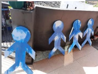
Gambar 35. Proses pengkaryaan