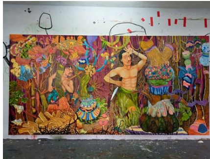
Gambar 1. Karya Kemal Ezedine ‘Ahmad Muhammad (2020)’