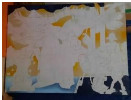
Gambar 19. Proses pengkaryaan