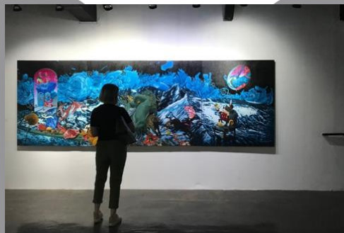
Gambar 2. Karya Gilang Fradika ‘Over The Hill and Far Away (2019)’

Selain Kemal Ezedine, penulis pula terinspirasi pada seniman lukis Gilang Fradika yang merupakan alumni dari seni grafis Universitas Negeri Yogyakarta tahun 2006. Sendirinya Gilang Fradika menetap dan berkarya seni di Yogyakarta dengan lokasi studionya yang berada di Kabupaten Bantul.