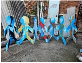
Gambar 37. Proses pengkaryaan