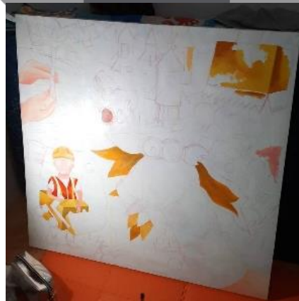
Gambar 11. Proses pengkaryaan Sumber: Dokumentasi pribadi 2021