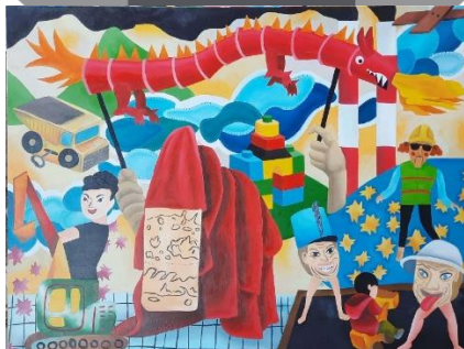
Gambar 39. DIY the Identity #2 90x120 cm Oil on Canvas Sumber: Dokumentasi pribadi 2021

DIY the Identity #1 berkonsep sebuah dinding yang penuh dengan permainan sebagai introduksi pada karya selanjutnya. Karya menampilkan representasi motif songket nago besaung pada objek berbentuk naga kaus kaki, motif songket pucuk rebung pada objek berbentuk mainan roket, motif songket bungo cino pada objek mainan kupu-kupu kertas dan coretan hitam. Terdapat pula representasi pegawai lapangan pertambangan batubara pada objek seorang anak dengan mainan dozer , representasi proses pertambangan batubara dengan objek mainan kardus dengan balon hitam sebagai simbol pengerukan batubara, objek mainan lintasan kertas dan bola hitam sebagai simbol proses penghancuran batubara yang baru saja ditambang dan objek kereta sebagai simbol pendistribusian batubara setelah dari tambang melewati persawahan Desa Karang Raja menuju ke dermaga.