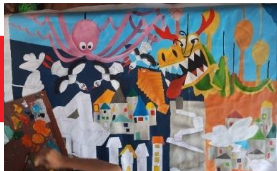
Gambar 29. Proses pengkaryaan