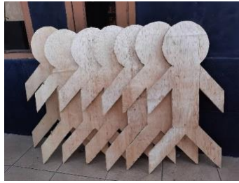
Gambar 32. Proses pengkaryaan