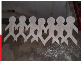
Gambar 33. Proses pengkaryaan