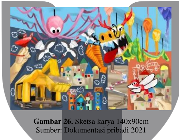
Gambar 26. Sketsa karya 140x90cm