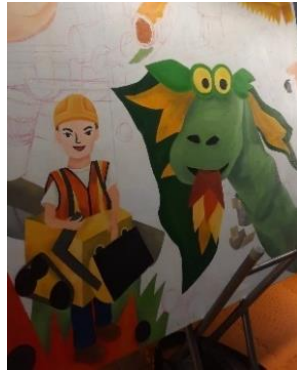
Gambar 12. proses pengkaryaan