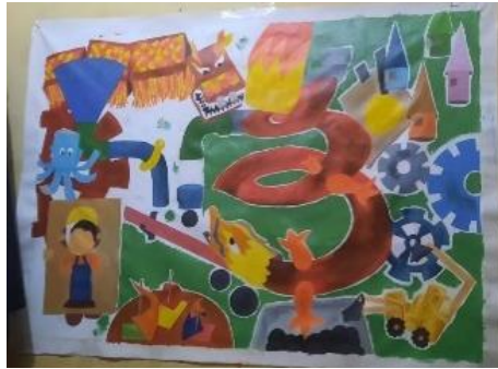
Gambar 16. Proses pengkaryaan