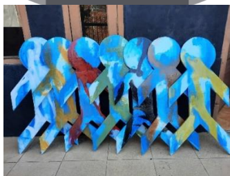
Gambar 36. Proses pengkaryaan