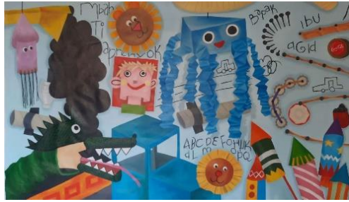
Gambar 41. DIY the Identity #4