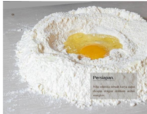
Gambar 2 Isi Karya "MasterLoaf"