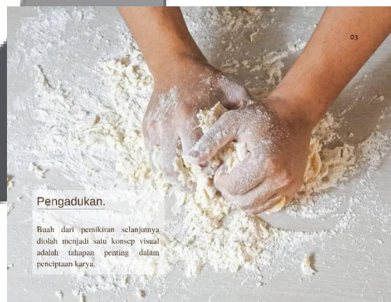
Gambar 4 Isi Karya "MasterLoaf"