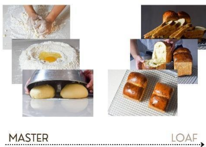
Gambar 1 Cover Karya

Hasil yang didapat dalam pembuatan karya ini yaitu dari proses pembuatan roti tawar dari awal hingga akhir menjadi roti tawar yang siap untuk disantap atau dijual, memiliki kesamaan proses pada proses berkaryanya penulis. Tahap-tahapan yang dilewati berhubungan dengan proses berkaryanya seniman. Disini bisa didapatkan hasil dalam pembuatan roti bukan hanya sekedar makanan biasa yang hanya bisa disantap, tetapi juga pembuatan roti ini pun memiliki nilai seni tersendiri apalagi bagi penulis. Berikut hasil dari proses pembuatan karya :