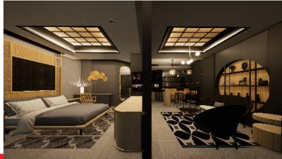
Gambar 4. Suite Room

rotan yang tidak biasa pada treatment ceiling yang tinggi tersebut. Treatment yang dipakai adalah teknik anyam dan carving yang memiliki level dengan irama tertentu.