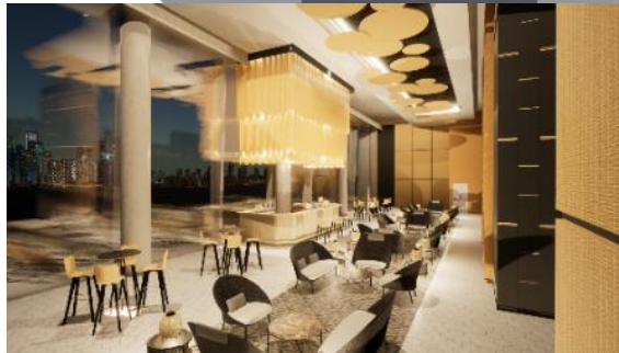
Gambar 3. Rooftop Lounge Sumber : Dokumentasi Pribadi, 2021

Pada area restoran kesan eksotis terdapat pada backdrop anyaman rotan yang dibentuk seperti lipatan. Bentuk tersebut dipertegas dengan lampu LED strip sehingga menjadi poin utama pada ruangan ini. Pada ruangan ini banyak dipadu dengan marmer berwarna abu-abu. Material marmer dipilih karena merupakan material yang mudah dibersihkan dan memiliki warna yang cocok sebagai pendamping warna natural rotan.