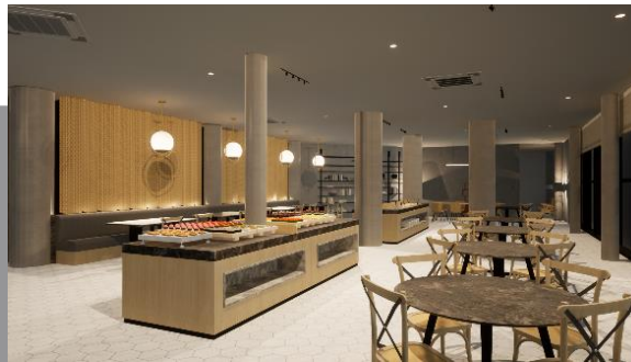
Gambar 2. Perspektif Restoran

Pada area Lobby dan resepsionis memiliki nilai eksotis rotan lewat ceiling. Konsep bentuk dan ornamen yang digunakan menunjukkan metode craftsmanship anyam dan carving . Pada area lounge memiliki ceiling yang bermain leveling dengan bentuk yang modern kontemporer. Pada Area resepsionis diberi juga nilai eksotis lewat instalasi lampu dengan rotan metode carving . Pada elemen dinding, furniture dan aksesoris menggunakan rotan yang dibentuk secara kontemporer sehingga menimbulkan kesan kekinian.