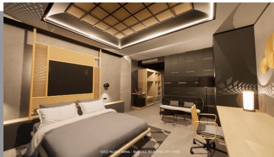
Gambar 5. Deluxe Room

Suite room ini merupakan kamar tipe tertinggi di hotel ini. Kamar ini menawarkan fasilitas terbaik dibanding kamar lainnya. Implementasi material rotan semuanya didesain agar terlihat berkelas. Kesan berkelas tersebut ditampilkkan lewat up ceiling anyaman rotan yang disoroti lampu LED strip . Dengan keunggulan memiliki ruang tamu terpisah, anyaman rotan juga menjadi sorotan utama di ruang ini pada rak backdrop yang ada. Furniture yang dipakai pada ruang tamu menggunakan rotan batang bending dan anyaman warna hitam dengan desain yang kontemporer namun berkelas. Dihiasi juga dengan pendant lamp dari material kuningan agar rotan disetarakan dengan material mewah.