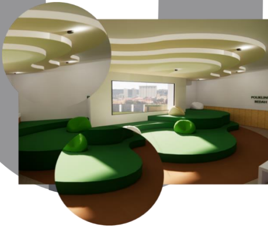
Gambar 9 Bentuk

Konsep bentuk yang akan digunakan adalah bentuk bentuk yang halus tidak tajam seperti lingkaran, oval, garis lengkung dan lainnya. Bentuk bentuk yang halus ramah terhadap anak anak tidak berbahaya, karena anak yang cukup aktif. Bentuk yang halus juga mengurahi rasa intens bagi pengunjung, dengan bentuk bentuk yang halus rasa yang dibangun lebih rileks dibandingkan dengan bentuk yang tajam seperti segitiga. Karena konsep awalnya adalah untuk mendistraksi pasien maka bentuk halus juga dapat membuat suasana yang ramah bagi pasien. Bentuk bentuk yang tidak tajam menstimulasi pikiran anak bahwa tempat ini adalah tempat yang baik untuknya disbandingkan tempat tempat dengan bentuk bentuk yang tajam karena bentuk bentuk tajam mengintimidasi anak-anak.