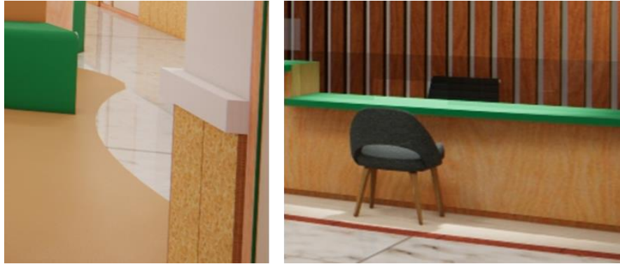
Railing, Pembatas antara pengunjung dan petugas