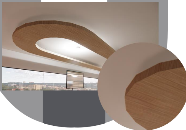
Gambar 3 Material HPL pada Ceiling

Pada perancangan Rumah Sakit Ibu dan Anak ini material yang digunakan adalah material yang tidak mudah kotor dan mudah di bersihkan, material yang digunakan harus tidak menempelkan bakteri atau virus. Material yang digunakan juga sesuai dengan standar covid 19 dan standar menteri Kesehatan RI, yaitu material yang tidak menempelkan dan menyebarkan penyakit. Ketahanan korosi yang tinggi pula. Setelah memenuhi standar covid di tambah oleh standar anak anak di bagian anak anak, material untuk anak anak yang terbuat dari kayu misalnya lebih ramah dibandingkan dengan logam karena kayu lebih empuk di bandingkan dengan logam. Material juga menjadi focus utama karena material bisa memperlihatkan tekstur yang akhirnya akan berhubungan dengan bentuk. Material lantai yang digunakan juga menggunakan vinyl untuk cleanroom, vinyl tidak memiliki sela sambunagan seperti keramik atau marmer sehingga bakteri tidak banyak menempel di sela lantai. Vinyl juga sangat mudah dibentuk sehingga dapat sesuai dengan konsep yang digunakan.