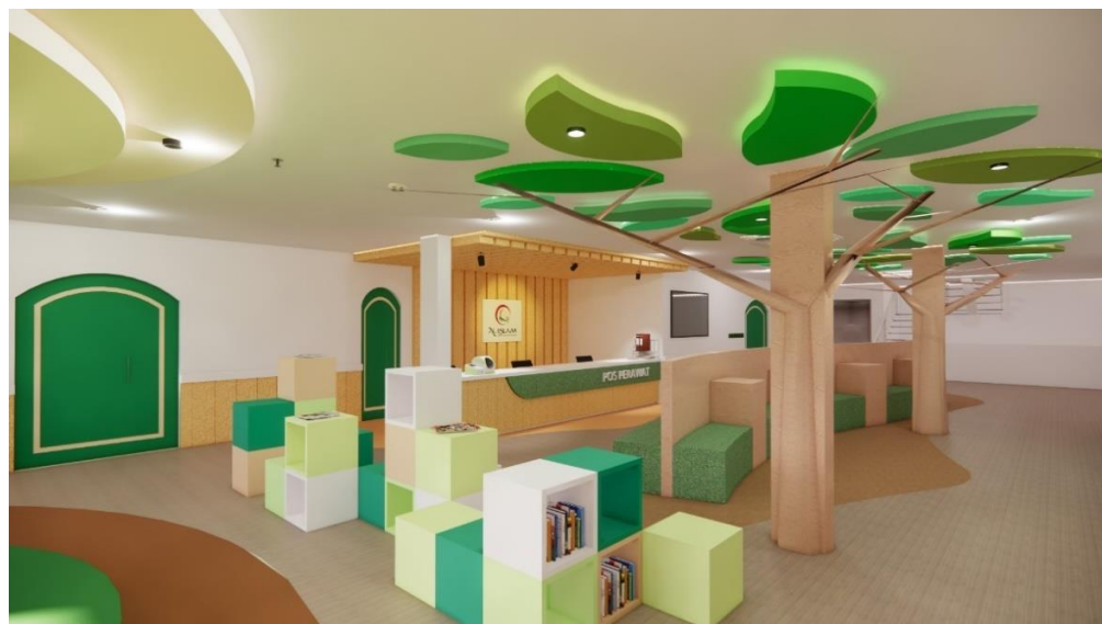
Gambar 7 Poliklinik Anak

Pada area poliklinik anak seluruh furniture pada ruang tunggu adalah furniture build in mulai dari sofa, area baca, dan area duduk, hingga ornamen pada kolom yang di buat sepi pohon di buat seperti biuld in.