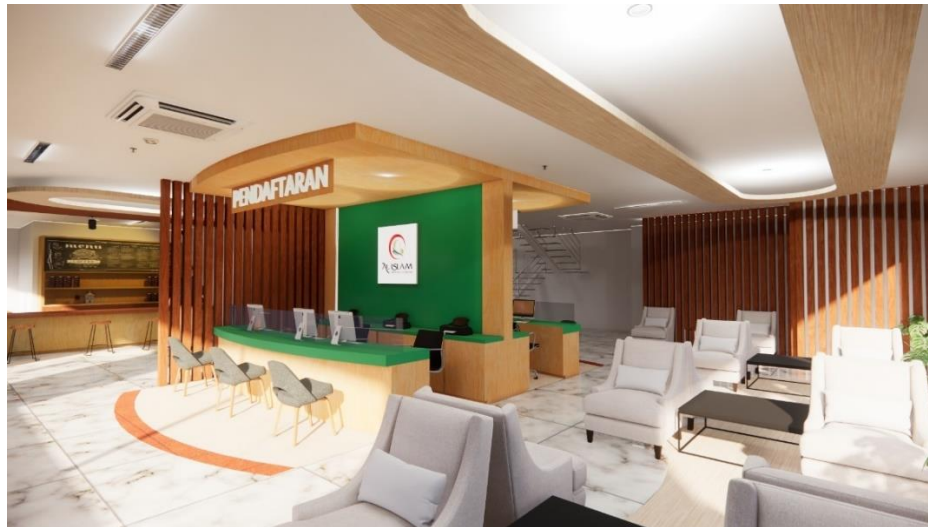
Gambar 6 Area pendaftaran

Pada area poliklinik anak seluruh furniture pada ruang tunggu adalah furniture build in mulai dari sofa, area baca, dan area duduk, hingga ornamen pada kolom yang di buat sepi pohon di buat seperti biuld in.