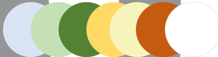
Gambar 11 Konsep Warna

Konsep warna yang digunakan adalah lebih kepada warna yang bersih dan ceria. Warna yang bersih seperti putih, cream dapat lebih menenangkan di bandingkan warna gelap. Warna biru dan hijau juga bisa menjadi pilihan warna kombinasi karena kedua warna ini bisa membantu pemulihan secara psikologis, warna ceria seperti merah, kuning, hijau dan biru bisa menjadi distraksi untuk anak anak, jadi bisa di terapkan untuk area anak anak. Warna warna primer juga lebih mencolok dibandingkan warna lainnya jadi warna ini terkesan lebih bersemangat dan cocok untuk anak anak agar tidak bosan