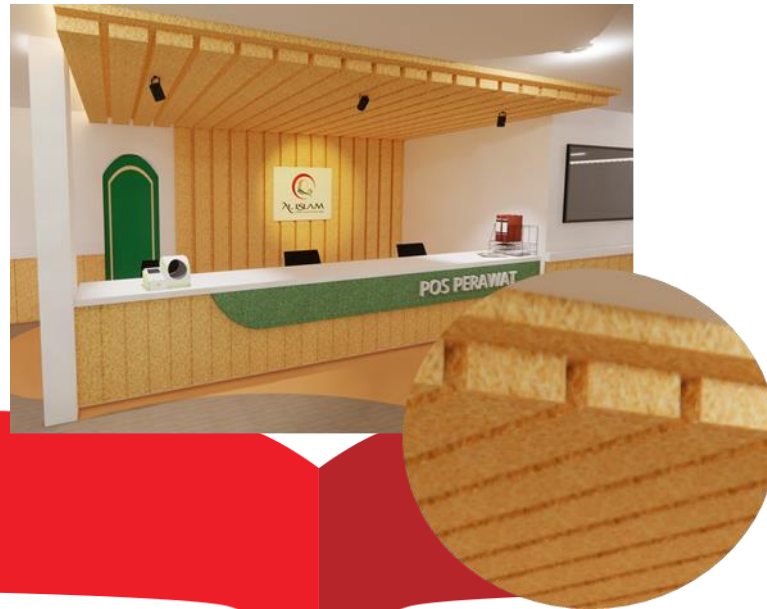
Gambar 4 Material Kayu Balok Pada Backdrop dan Ceiling