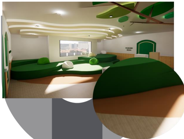
Gambar 5 Material Carpet dan Vinyl untuk Upfloor dan Lantai

Material yang dipilih adalah material yang ramah bagi anak-anak, empuk dan tidak keras seperti vinyl, carpet, kayu dan lainnya.