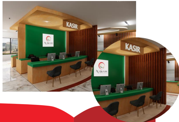
Gambar 10 Bentuk Sumber. Dokumen Pribadi