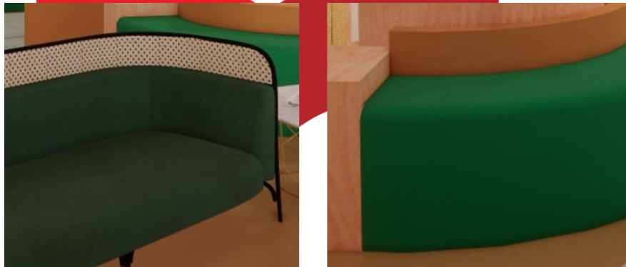
Material yang empuk, Bentuk yang tidak tajam