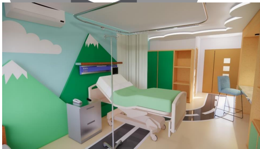
Gambar 12 Konsep Warna