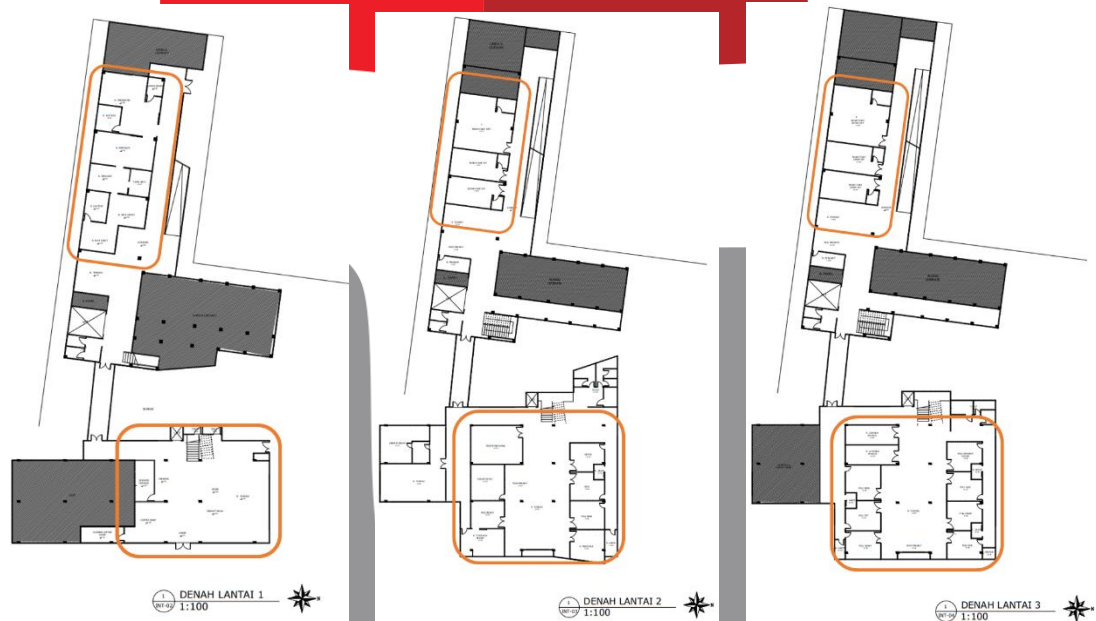
Gambar 1 Organisasi Cluster

Organisasi ruang yang digunakan berdasarkan literatur dan studi banding adalah organisasi ruang cluster. Organisasi ruang ini mengelompokkan berdasarkan kedekatan ruang dan fungsi dari ruang-ruang tersebut. Dalam proyek perancangan ini ruang-ruang dipisahkan berdasarkan fungsi contohnya dalam pada lantai 1 gedung 1 terdapat kelompok fasilitas public seperti pendaftaran, kasir, farmasi dan coffee shop. Sedangkan pada area poli klinik, di pisahkan poliklinik untuk anak-anak pada lantai 2 dan poliklinik umum pada lantai 3. Begitu juga dengan ruang rawat inap di pisahkan antara ruang inap anak dan umum.