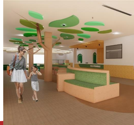
Gambar 8 Sofa Build in Sumber. Dokumen Pribadi