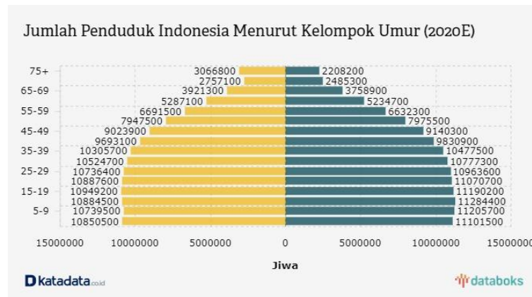
Gambar 1.1 Jumlah Penduduk Indonesia Menurut Kelompok Umur 2020

Berdasarkan data di atas jumlah penduduk terbanyak merupakan generasi milenial, oleh karena itu generasi milenial sangat menentukan dalam pelestarian batik di Indonesia. Generasi milenial sendiri cenderung lebih suka berbelanja secara online melalui marketplace maupun media lainnya dari pada harus datang ke toko secara langsung, selain menghemat waktu berbelanja secara online juga tidak menghabiskan energi. Namun Saat ini Batik Suminar hanya mengandalkan penjualan produk melalui toko atau gerai, dan tidak mengoptimalkan penjualan produk melalui marketplace . Oleh karena itu masalah tersebut dapat diatasi dengan pembuatan marketplace dengan strategi kreatif promosi Batik Suminar Kediri yang dapat menarik generasi milenial serta membuat media visual yang tepat untuk menarik minat calon konsumen agar membeli produk Batik Suminar Kediri, selanjutnya untuk mempromosikan produk dari Batik Suminar Kediri dapat dilakukan dengan cara penjualan secara online melalui marketplace ataupun web , dengan harapan agar generasi milenial tertarik dengan produk batik dan membeli produk batik dari Suminar Kediri.