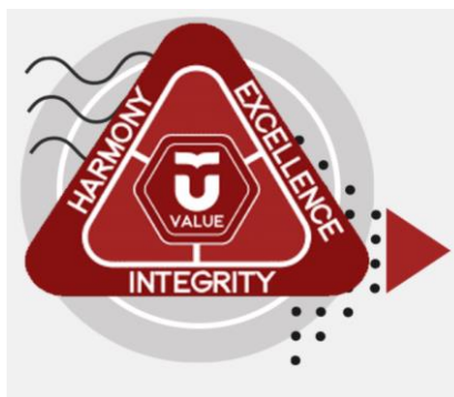
Gambar 1. 1 Nilai-Nilai Budaya Telkom University

Telkom University memiliki nilai budaya yakni HEI yang juga bertindak sebagai kunci perilaku budaya institusional di Telkom University. HEI adalah nilai mulia yang berdiri untuk Harmony, Excellence, dan Integrity (Telkom University, 2020).