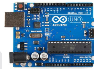
Gambar 1. Arduino

Arduino adalah sebuah platform open-source yang digunakan untuk membangun dan pemrograman elektronik. Arduino dapat menerima dan mengirimkan informasi ke banyak perangkat bahkan melalui internet dapat memerintah perangkat elektronik tertentu. Ini menggunakan perangkat keras yang disebut Arduino Uno berbentuk circuit board dan perangkat lunak berupa pemrograman Simplified C++ . Pada zaman modern ini, Arduino banyak digunakan sebagai mikrokontroler karena penggunaan yang mudah dari pada mikrokontroler lainnya. Arduino memiliki chip yang dapat diprogram untuk melakukan sejumlah tugas yang dimana informasi akan dikirim dari program komputer ke mikrokontroler dengan beberapa sirkuit untuk melaksanakan perintah yang spesifik[9].