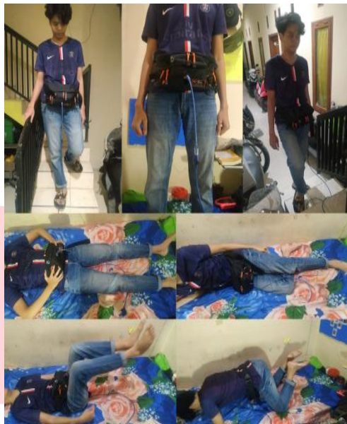
Gambar 8. Proses Pengambilan Data