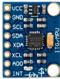
Gambar 2. Sensor MPU-6050