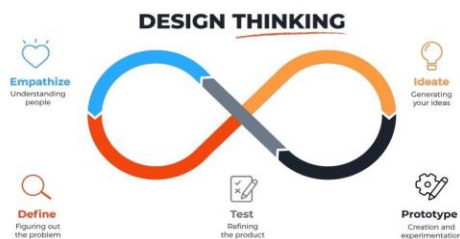
Gambar 1 Design Thinking