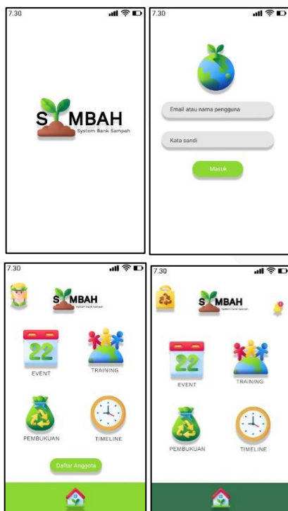
Gambar 4 Prototype Perancangan Aplikasi SYMBAH

Berikut merupakan prototype dari perancangan aplikasi SYMBAH :