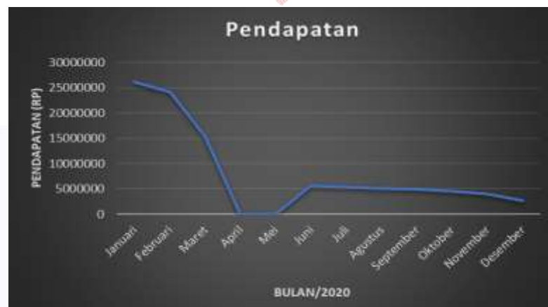
Gambar 1 Pendapatan RM. Moro Seger

Pada awal tahun 2020 yaitu bulan Januari, RM. Moro Seger berjalan dengan normal, namun pada bulan maret pertengahan terjadi wabah penyebaran virus yang disebut Covid-19. Adanya wabah tersebut mengubah keadaan perusahaan terutama mempengaruhi kondisi keuangan. Berikut merupakan grafik pendapatan RM. Moro Seger dalam tahun 2020 terhitung sejak Januari sampai dengan Desember dapat dilihat pada Gambar 1.