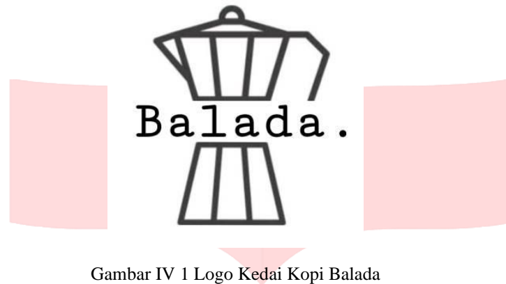
Gambar IV 1 Logo Kedai Kopi Balada

Semakin berkembang pesatnya industri kopi di daerah Bandung, Kedai Kopi Balada merupakan perusahaan yang bergerak di bidang industri F&B yang memiliki total luas lahan bengkel sekitar 50 m 2 . Produk Utama dari Kedai Kopi Balada adalah berfokus pada service tempat kopi dengan konsep tempoe doloe yang terletak di Click Square Mall Lt 04, produk dari Kedai Kopi Balada yaitu espresso based , beans honey , Es Kopi Susu, Iced based Milk , V60 , Vietnam Drip untuk makanan ada friens fries , Roti Bakar dan spaghetti bolognese . Semua produk Kedai Kopi Balada merupakan produk yang sudah sesuai dengan resipi dari pada Kedai Kopi Balada. Perusahaan ini mengambil barang dari beberapa distributor Kopi dan Beans yang berada di daerah Bandung dan sekitarnya.