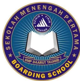
Gambar 1.1 Logo SMK Daarut Tauhiid

Berikut adalah logo SMK Daarut Tauhiid Boarding School :