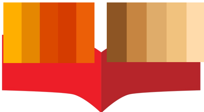
Gambar 2 Warna

Menggunakan warna yang mendeskripsikan suasana santai, dan menyenangkan serta memberikan simbol kreatifitas, dan menggunakan beberapa warna turunan yang mengesankan suasana hangat dan memberikan kesan simple . Maka dari itu digunakan warna sebagai berikut;