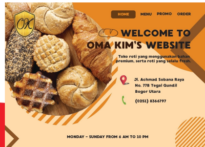
Gambar 4 Website