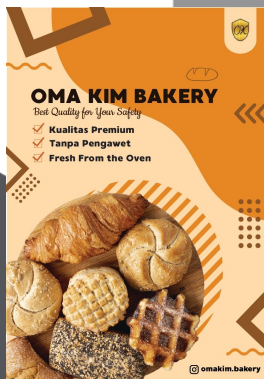
Gambar 3 Poster