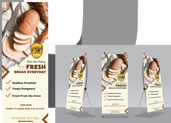
Gambar 5 Standing Banner