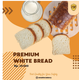
Gambar 6 Konten Media Sosial