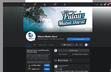
Gambar 8. Facebook

Penggunaan media promosi facebook dikarenakan, facebook memiliki fitur facebook ads yang akan sangat membantu dalam mempromosikan destinasi wisata ini. Sehingga, dapat menjangkau lebih banyak lagi target audiens. Konten-konten yang dibuat akan bersifat persuasif , karena akan membujuk audiens agar tertarik terhadap destinasi wisata ini.