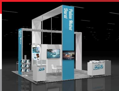
Gambar 10. Action booth

Action Booth digunakan sebagai action dalam pembuatan perancangan ini, dimana pengunjung akan di tarik perhatiannya oleh attention dan juga interest . Dalam action booth akan diperjualkan tiket menuju destinasi wisata Pulau Mubut Darat dengan berbagai promosi yang menarik.