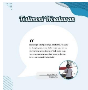
Gambar 12. Testimonial

Testimonial merupakan salah satu bagian dari share yang dimana, pengunjung yang telah berkunjung ke destinasi wisata ini akan membagikan pengalaman dan keseruan mereka saat berlibur, sehingga nantinya akan di share melalui media sosial masing-masing dan yang terbaik akan di repost oleh akun sosial media dari Pulau Mubut Darat dan kemudian akan mendapatkan merchandise gratis.