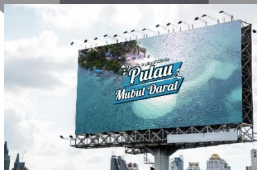
Gambar 6. Videotron

Perancangan videotron akan berupa video yang bersifat mengajak ( persuasif ). Perancangan videotron ini akan memuat positioning dan USP yang dimiliki oleh destinasi wisata Pulau Mubut Darat yaitu camping .