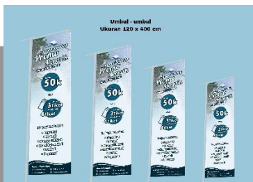
Gambar 5. Umbul-umbul

Umbul-umbul digunakan untuk menginformasikan mengenai destinasi wisata yang lebih sedikit dibandingkan dengan poster maupun brosur. Perancangan desain umbul-umbul akan dibuat secara simpel dan jelas tentang informasi yang dibutuhkan. Media umbul-umbul akan digunakan pada setiap persimpangan empat lampu merah di Kota Batam.