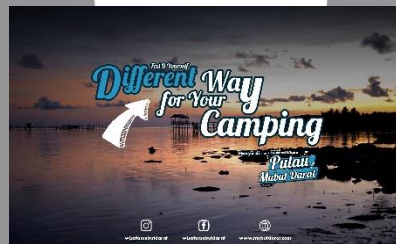
Gambar 2. Poster

Poster digunakan untuk attention kepada khalayak umum. Dimana tahap pertama yang menentukan apakah khalayak tertarik dengan destinasi wisata Pulau Mubut Darat, sehingga poster yang dibuat harus dapat menarik perhatian dari khalayak umum. Agar khalayak umum dapat tertarik untuk melihat apa saja yang terdapat di destinasi wisata ini.