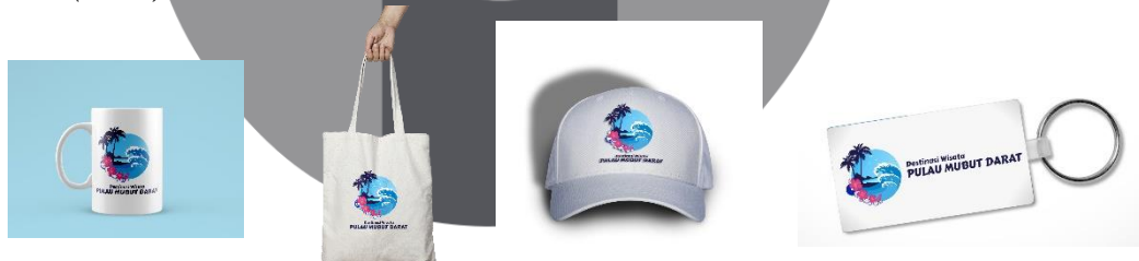
Gambar 11. Merchandise

Merchandise atau souvenir yang akan kita dapatkan pada saat mengunjungi suatu acara atau suatu tempat. Merchandise berfungsi sebagai pengingat wisatawan bahwa ia telah pernah mengunjungi destinasi wisata ini. Beberapa jenis merchandise yang akan dibuat seperti gantungan kunci, topi, gelas dan juga tas.