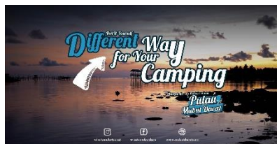
Gambar 3. Billboard