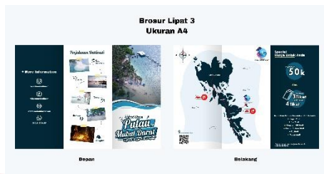
Gambar 4. Brosur

Brosur merupakan salah satu alat promosi yang bersifat persuasif , dimana pembaca akan mendapatkan informasi mengenai apa yang ada didalam brosur tersebut. Penggunaan brosur dimaksudkan untuk memberikan informasi secara detail dan jelas kepada pembaca terhadap destinasi wisata yang ditawarkan. Yang dimana brosur tersebut akan dibagikan pada tempat-tempat umum seperti di pusat perbelanjaan ( mall ).