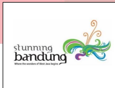
Gambar 1. Logo Stunning Bandung

Kota Bandung merupakan Ibu Kota Provinsi Jawa Barat yang memiliki beragam keindahan kota. Kota Bandung banyak dikenal dan dikunjungi karena banyak destinasi wisata di dalamnya, mulai dari wisata alam, wisata belanja, wisata kuliner, bahkan situs bersejarah. Sebagai kota besar dengan banyak destinasi, pemerintah melakukan upaya untuk terus meningkatkan pengunjung atau wisatawan dari berbagai daerah, bahkan mancanegara. Salah satu upaya yang dilakukan adalah branding kota. Salah satu city branding Kota Bandung yang saat ini sedang dijalankan ialah ‘ Stunning Bandung ’ yang menjadi program smart branding dalam membantu mewujudkan Bandung Smart City ( www.smartcity2.bandung.go.id , 2018).