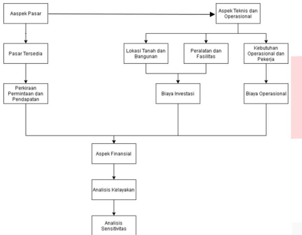
Gambar 2 Model Konseptual Pembukaan Cabang Wikana Konfeksi