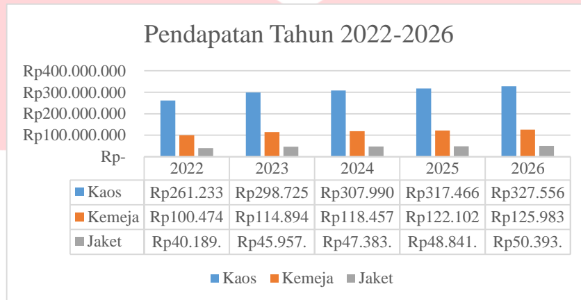
Gambar 3 Pendapatan Tahun 2022-2026

Wikana Konfeksi mendapatkan pendapatan dari harga jual setiap produknya. Produk yang diproduksi oleh wikana konfeksi terdiri dari kaos, kemeja, dan jaket. Pendapatan dihitung dengan mengalikan volume produksi dengan harga jual masing-masing produk. Pendapatan tahun 2022-2026 ditunjukkan pada gambar berikut: