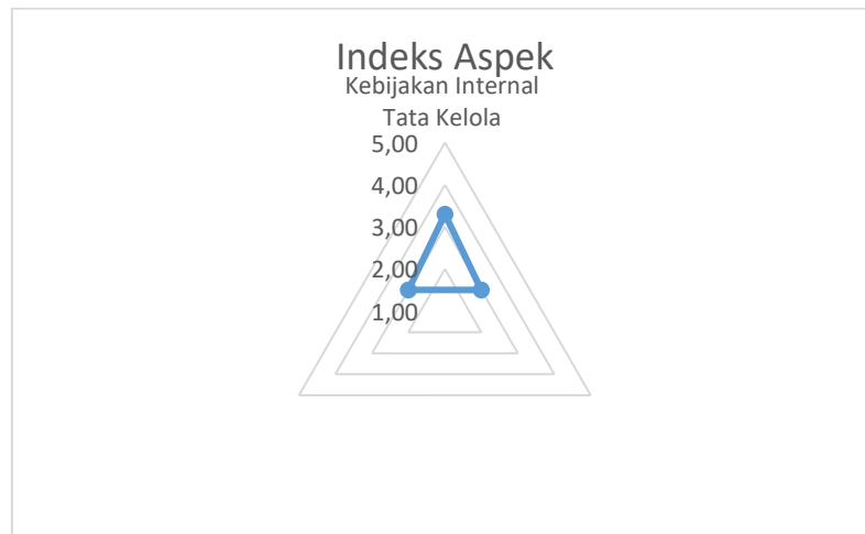
Gambar 3. Indeks Aspek Kebijakan Internal SPBE

Gambar 3 memaparkan ketiga aspek yang ada di dalam Kebijakan Internal SPBE pada Diskominfo Kota Bandung. Grafik diatas memaparkan seluruh aspek yang ada beserta tingkat kematangannya masing-masing.