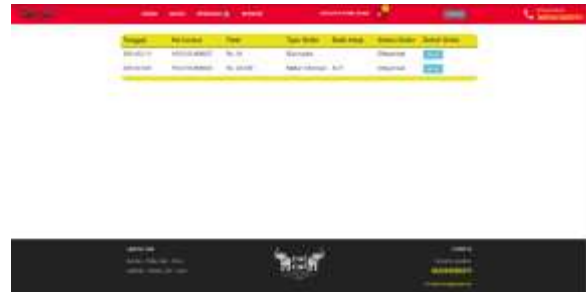
Gambar 9 Pesanan

Pada gambar 9 adalah mockup dari halaman pesanan. Disini user dapat melihat pesanan yang sudah dibayarkan, diantaranya user dapat melihat tanggal transaksi, no invoice, total harga, tipe order, kode meja jika memilih makan ditempat, status order dan detail dari pesanan.