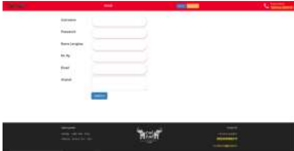
Gambar 2 Register

Pada gambar 2 adalah mockup dari halaman register untuk calon pengguna mendaftarkan di aplikasi Chi-Chi Thai Tea. Di halaman tersebut disediakan form yang harus diisi oleh calon pengguna. Terdapat beberapa syarat untuk mengisi form diantaranya tidak boleh menggunakan username yang sudah pernah digunakan dan form tidak boleh ada yang kosong.