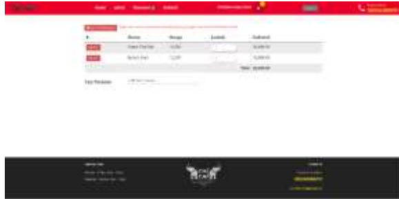
Gambar 7 Keranjang

Pada gambar 7 adalah mockup dari halaman keranjang. Disini user dapat melihat produk yang sudah dipesan. User dapat menambahkan jumlah pada masing-masing produk. User juga dapat memilih tipe pesanan. Jika user tidak yakin dengan pesanan maka user dapat memilih delete menu. Setelah itu user dapat memilih bayar pesanan dan akan langsung diarahkan ke halaman struk.