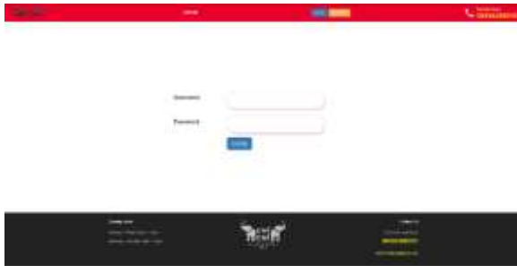
Gambar 3 Login

Pada gambar 2 adalah mockup dari halaman register untuk calon pengguna mendaftarkan di aplikasi Chi-Chi Thai Tea. Di halaman tersebut disediakan form yang harus diisi oleh calon pengguna. Terdapat beberapa syarat untuk mengisi form diantaranya tidak boleh menggunakan username yang sudah pernah digunakan dan form tidak boleh ada yang kosong.