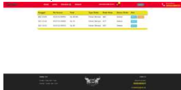
Gambar 10 Riwayat

Pada gambar 10 adalah mockup dari halaman riwayat. Disini user dapat melihat riwayat pesanan yang sudah pernah dipesan. User dapat memilih detail dari pesanan yang sudah pernah dipesan dan untuk pesanan yang baru selesai maka dapat diberikan ulasan dengan memilih tombol ulasan