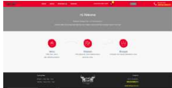
Gambar 4 Home

Pada gambar 4 adalah mockup dari halaman home. Disini user yang sudah melakukan login. Disini user dapat melakukan pemesanan produk dengan memilih menu, dapat melihat status pesanan dengan memilih pesanan dan dapat melihat riwayat pembelian dengan memilih riwayat. User juga dapat keluar dari aplikasi dengan memilih Logout.