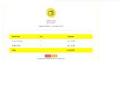
Gambar 8 Struk

Pada gambar 8 adalah mockup dari halaman Struk. Disini user dapat melihat kode invoice dari pesanan dan detail dari produk beserta total biayanya. Jika sudah yakin maka user dapat memilih bayar dan diarahkan langsung ke halaman pesanan, jika user tidak yakin dapat memilih batal dan akan diarahkan ke halaman home.