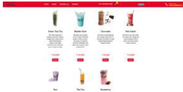
Gambar 5 Menu

Pada gambar 5 adalah mockup dari halaman menu. Disini user dapat melihat menu apa saja yang tersedia di aplikasi Chi-Chi Thai Tea. User dapat melihat detail dari produk tersebut dengan memilih nama produk, dan setelah yakin user dapat memilih pesan sehingga produk yang dipesan akan masuk ke dalam keranjang