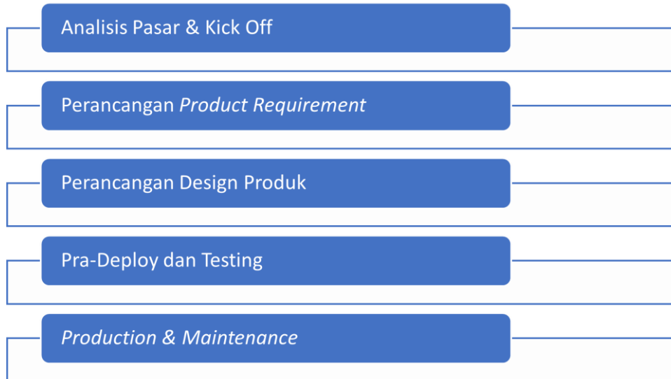
Gambar 1 Bagan Product development Process

Secara umum, kami membagi proses development produk kedalam lima level , seperti digambarkan pada Gambar. 1. Adapun rincian prosesnya, dituliskan dalam Tabel. 3