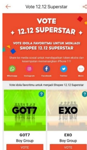
Gambar 1.12 Fitur Vote 12.12 Superstar Shopee

Oleh karena itu, dengan melihat para pesaing Shopee yang menggunakan beberapa selebriti dalam pemanfaatan sasaran yang tepat untuk menjangkau pasarnya. Maka Shopee juga mengadakan acara bertajuk “Shopee Next Superstar” dengan sistem yang sama oleh Tokopedia yaitu menyediakan fitur untuk memilih selebriti yang akan tampil dalam acara Shopee Next Superstar selanjutnya. Seperti terpilihnya Stray Kids sebagai selebriti yang tampil pada 11.11 Superstar berdasarkan hasil dari voting yang terbanyak pada “Vote 11.11 Superstar” Berikut pada Gambar 1.10 fitur “Vote Next Superstar Shopee” yang tersedia di aplikasi Shopee