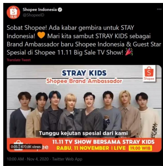
Gambar 1.5 Stray Kids dikonfirmasi sebagai brand ambassador (Twitter)

Pada Gambar 1.4 akun Instagram resmi Shopee menyatakan grup musik asal Korea Selatan, Stray Kids untuk menjadi brand ambassador Shopee Indonesia sekaligus menjadi bintang tamu utama pada acara 11.11 Big Sale TV Show yang akan ditampilkan di beberapa stasiun televisi Indonesia dan live streaming melalui Youtube resmi Shopee.