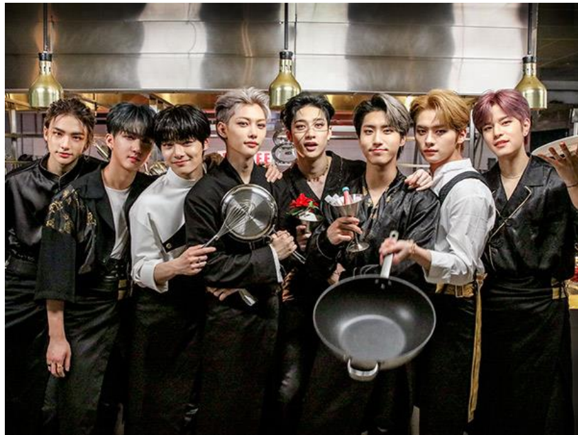
Gambar 1.10 Stray Kids photoshoot video musik God's Menu Sumber: straykids.jype.com, yang diakses pada 14 November 2020

terbaru pada tahun 2020 berhasil mencetak lebih dari 300.000 keping pada pemesanan album yang berjudul dengan IN LIFE dalam waktu kurang dari tiga hari sebelum album tersebut dirilis. Pada album yang sama Stray Kids juga sukses di persaingan album di iTunes yang berada di 23 negara berbeda sesuai satu hari tanggal dirilis. Serta seluruh anggota Stray Kids yang beranggotakan 8 orang ikut berperan untuk menulis seluruh lagu di album IN LIFE (idntimes.com, diakses pada 14 November 2020).