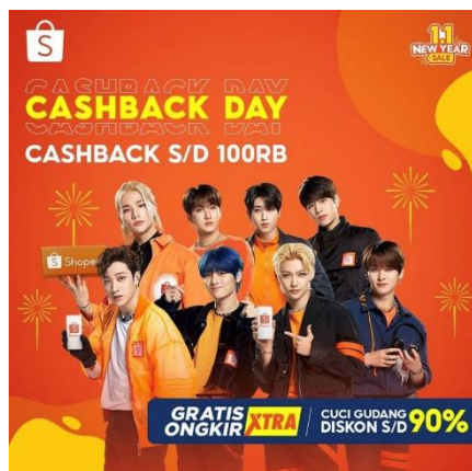
Gambar 1.8 Stray Kids dalam iklan 1.1 New Year Sale Shopee Instagram

Selain itu posisi Stray Kids yang menjadi brand ambassador juga turut hadir pada beberapa acara besar yang diadakan oleh Shopee tiap bulannya. Pada Gambar 1.8 terdapat Stray Kids muncul pada iklan Shopee dalam perayaan tahun baru yaitu 1.1 New Year Sale dengan beberapa promo yang ditawarkan oleh Shopee. Dapat dilihat sebagai berikut.