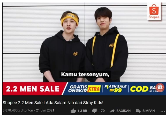
Gambar 1.9 Stray Kids dalam iklan Youtube 2.2 Men Sale Shopee

Stray Kids sendiri adalah grup musik boyband yang berasal Korea Selatan berkarir dibawah naungan agensi JYP Entertainment. Awalnya Stray Kids dibentuk dalam survival program dengan nama yang serupa yaitu Stray Kids dan kemudian memulai karir debutnya pada tanggal 25 Maret 2018 sekaligus perilisan album mini pertama yang berjudul I am YOU dengan lagu utamanya yaitu District 9. Grup musik ini beranggotakan delapan orang terdiri dari Bang Chan sebagai leader , Hyunjin, Han, Seungmin, Felix, Changbin, Lee Know dan yang paling termuda yaitu I.N. Stray Kids dikenal sebagai grup musik yang memiliki performa, energi, dan semangat yang selalu penuh. Stray Kids juga memproduksi musiknya sendiri, walaupun tidak dihitung secara keseluruhan tetapi peran beberapa anggota ikut turut andil dalam setiap lagu yang dimiliki oleh Stray Kids. Sebagian dari mereka yaitu Bang Chan, Changbin, dan Han anggota yang mendominasi dalam pembuatan lagu, atau dikenal sebagai sub-unit 3RACHA Yang dikutip melalui ( shopee.co.id , diakses pada tanggal 14 November 2020).