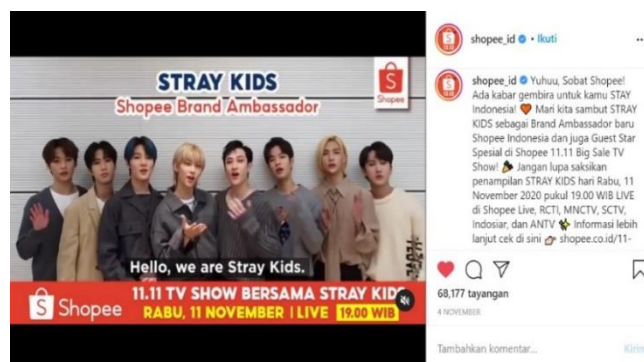
Gambar 1.4 Stray Kids dikonfirmasi sebagai brand ambassador (Instagram) Sumber: instagram.com/shopee_id diakses pada 14 November 2020

Kepopuleran Shopee juga di pengaruhi oleh strategi pemasaran yang gencar dalam menarik perhatian pelanggan untuk memperkenalkan mereknya kepada khalayak. Menurut Tjiptono (2011: 219) komunikasi pemasaran adalah kegiatan dari pemasaran dengan upaya membujuk, melakukan penyebaran informasi, dan dapat diingat oleh target audiens tentang perusahaan suatu merek untuk bersedia membeli, menerima, dan loyal terhadap perusahaan merek tawarkan. Penggunaan brand ambassador merupakan salah satu bentuk strategi pemasaran untuk menghubungkan brand dengan konsumen secara emosional, Shimp (2003: 455). Hal ini telah dilakukan oleh Shopee untuk memakai beberapa brand ambassador pada kegiatan promosinya. Secara berturut-turut mulai dari tahun 2018 hingga 2020 Shopee menggunakan brand ambassador dari kalangan selebriti internasional. Diantaranya yaitu pada tahun 2018 Shopee meresmikan Blackpink girlgrup asal Korea Selatan sebagai brand ambassador pada acara perayaan Birthday Sale 12.12 Kemudian pada tahun 2019 Shopee mengajak Cristiano Ronaldo pemain bola skala internasional sebagai brand ambassador pada perayaan 9.9 Super Shopping Day. Selanjutnya pada tanggal 4 November 2020 Shopee meresmikan di beberapa media sosial untuk mengajak Stray Kids boyband asal Korea Selatan yang merupakan selebriti K-pop sebagai brand ambassador .