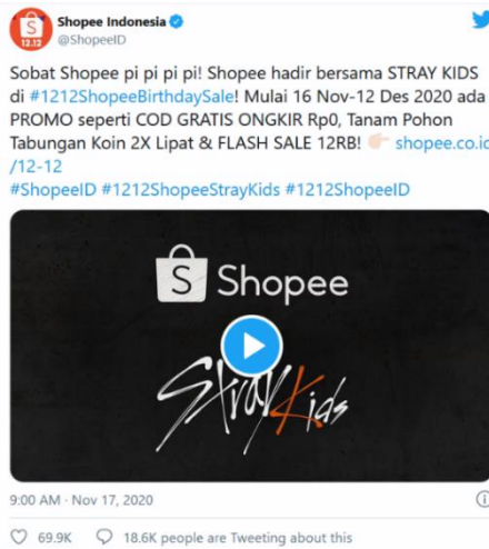
Gambar 1.7 Stray Kids dalam iklan Shopee 12.12 Birthday Sale Twitter Sumber: twitter.com/ShopeeID diakses pada 17 November 2020

Selain itu posisi Stray Kids yang menjadi brand ambassador juga turut hadir pada beberapa acara besar yang diadakan oleh Shopee tiap bulannya. Pada Gambar 1.8 terdapat Stray Kids muncul pada iklan Shopee dalam perayaan tahun baru yaitu 1.1 New Year Sale dengan beberapa promo yang ditawarkan oleh Shopee. Dapat dilihat sebagai berikut.